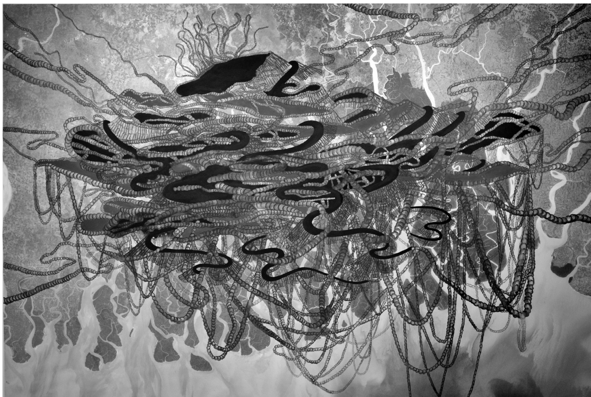
Catherine Bolduc, South Talpatti en lévitation au-dessus des Sundarbans , 2013. Impression numérique, peinture acrylique et aquarelle sur papier, 122 x 183 cm. Collection de la Banque Nationale.