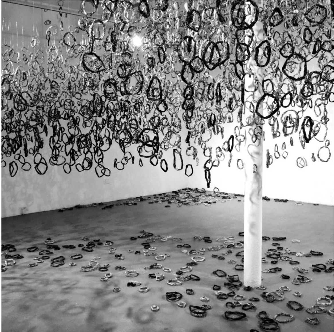
Andrée-Anne Dupuis Bourret, Proliférations , 2014. Papiers sérigraphiés, broches, fil de nylon, punaises, dimensions variables. Eastern Edge Gallery, St-John's, Terre-Neuve.