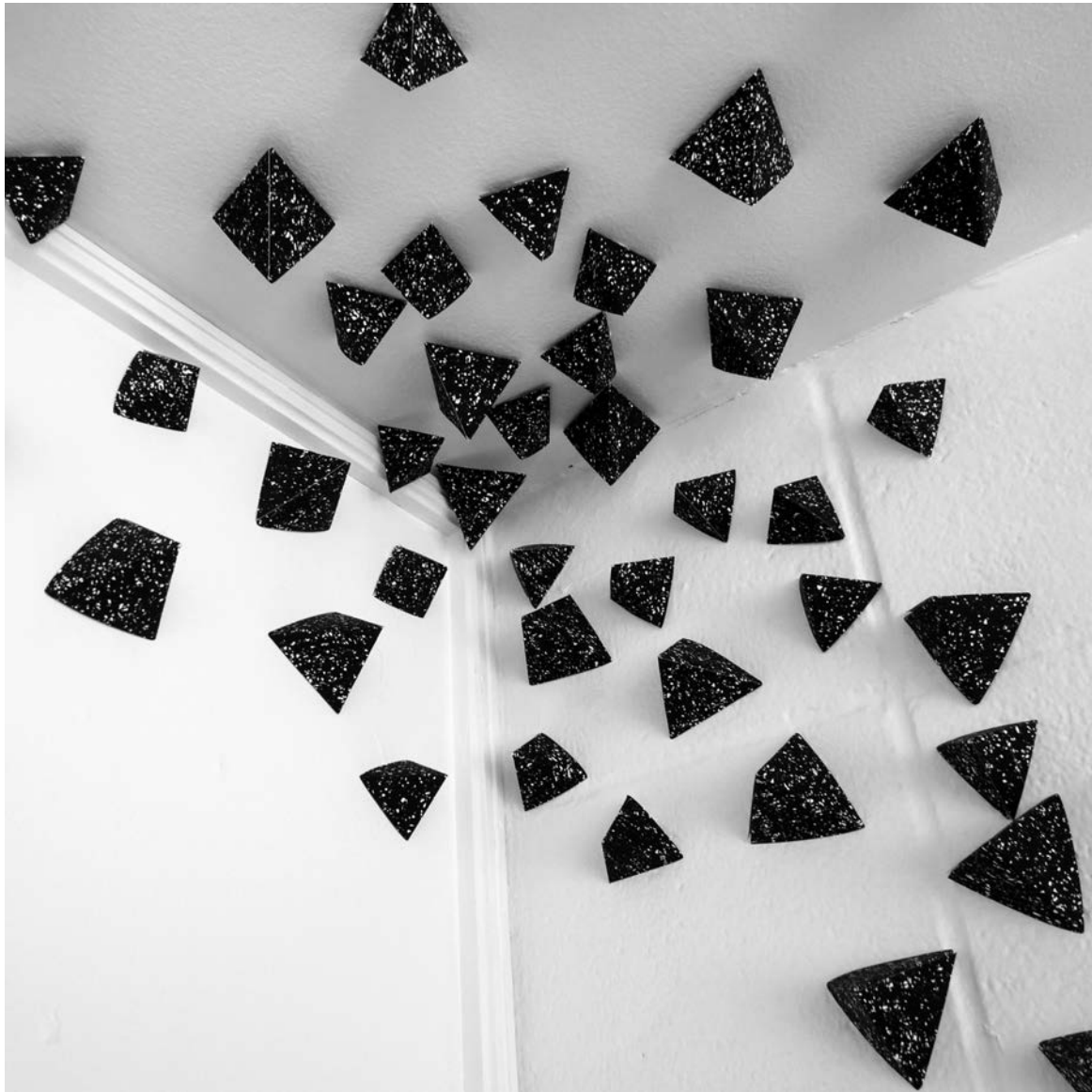
Andrée-Anne Dupuis Bourret, Paper Fiction (détail), 2011. Papiers sérigraphiés, gommettes. Hostel Hi, Winnipeg, Manitoba.