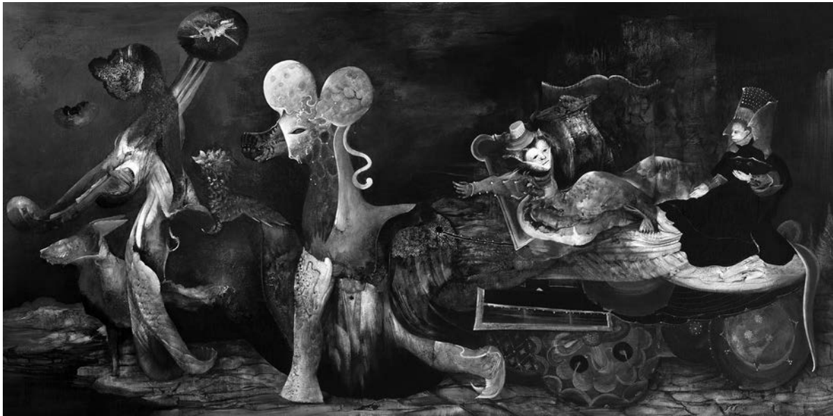
Jaber Lutfi, Chariot , 2011. Acrylique sur bois, 61 cm x 122 cm.