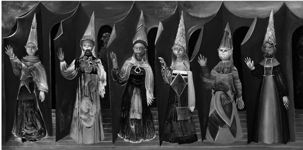
Jaber Lutfi, Répétition , 2012. Acrylique sur toile, 61 cm x 122 cm.