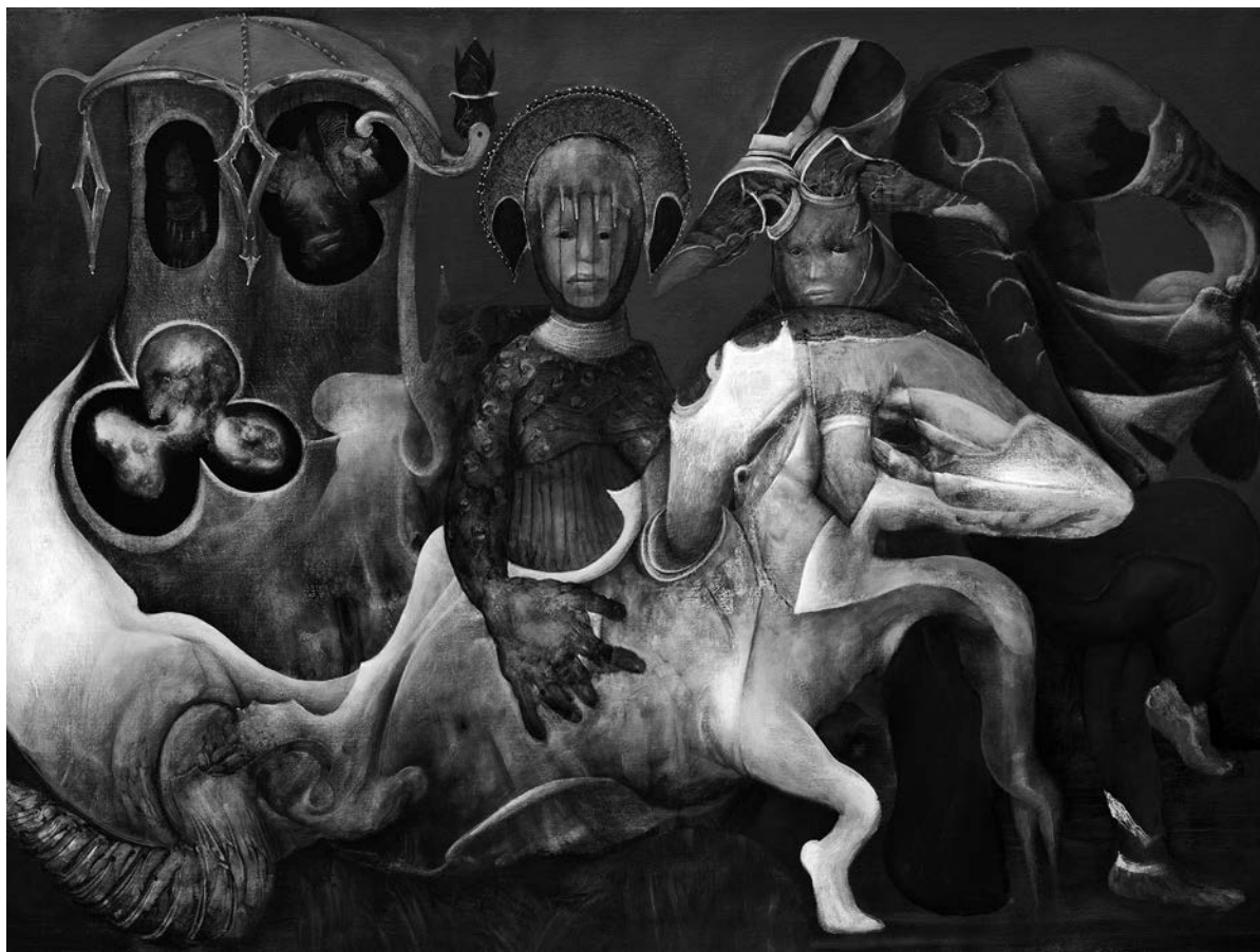
Jaber Lutfi, Dragon , 2010. Acrylique sur toile, 76 cm x 101 cm. Collection privée.