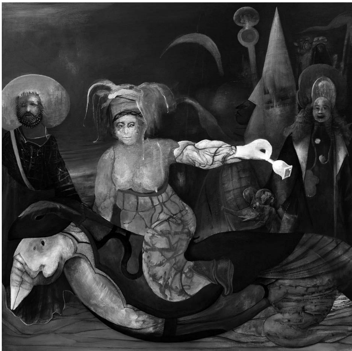
Jaber Lutfi, Le fou sonne le glas , 2008. Acrylique sur toile, 91 cm x 91 cm. Collection privée.