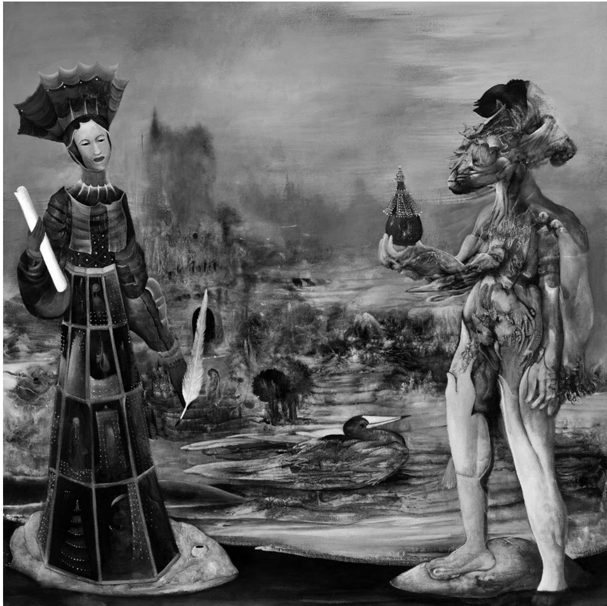
Jaber Lutfi, La liberté éclairant le monde , 2011. Acrylique sur toile, 91 cm x 91 cm.