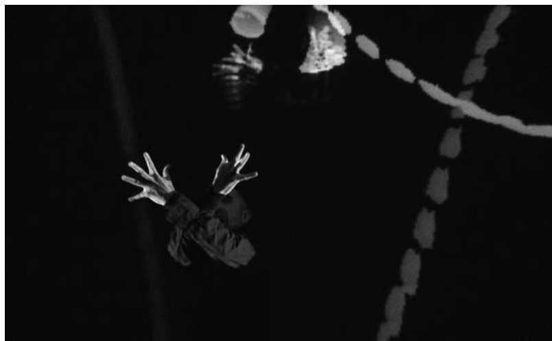
FIGURE 1 Light Music en concert : geste croisement-pentagone