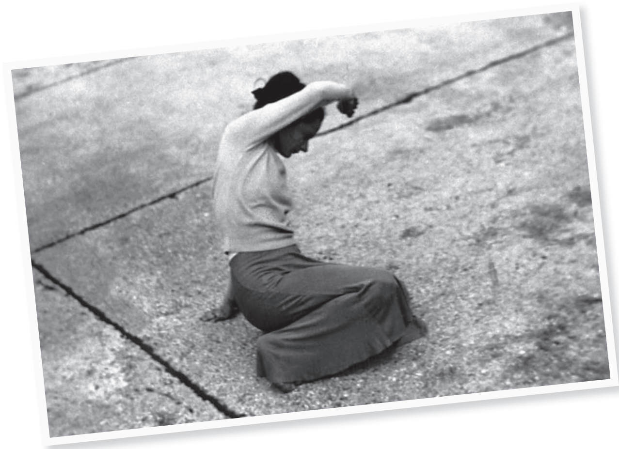
Jeanne Renaud interprète son œuvre chorégraphique L'Emprise , Paris, 1950.