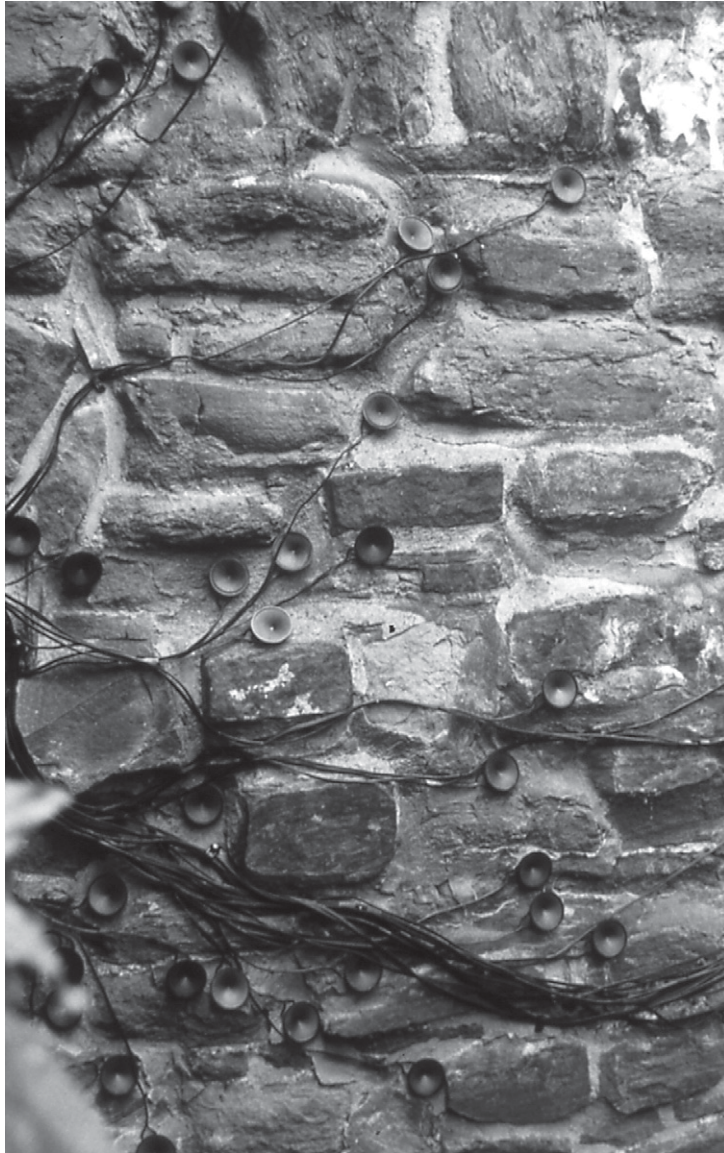
Robin Minard, Silent Music (1994), Mutiple Sounds II Festival, Helpoort, Maastricht, Hollande