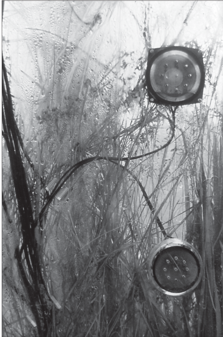
Robin Minard, Klangweg (1994), détail, Landesgartenschau, Paderborn, Allemagne