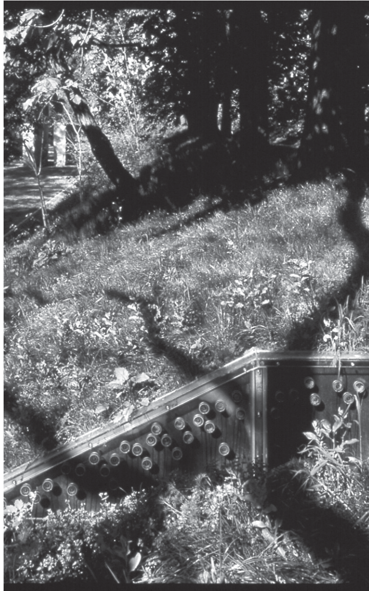
Robin Minard, Intermezzo (1999), Bundesgartenschau, Magdeburg, Allemagne