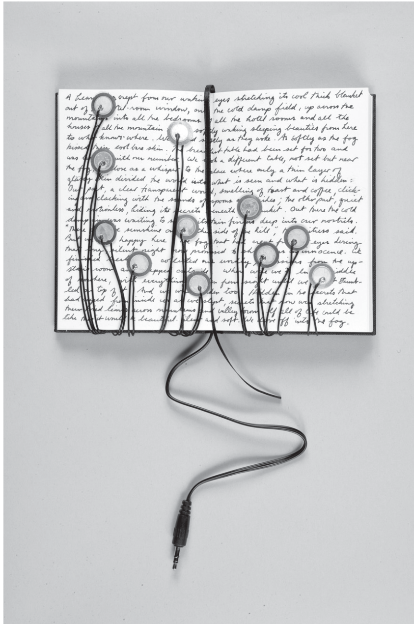
Robin Minard, à lire en silence (2006), détail.