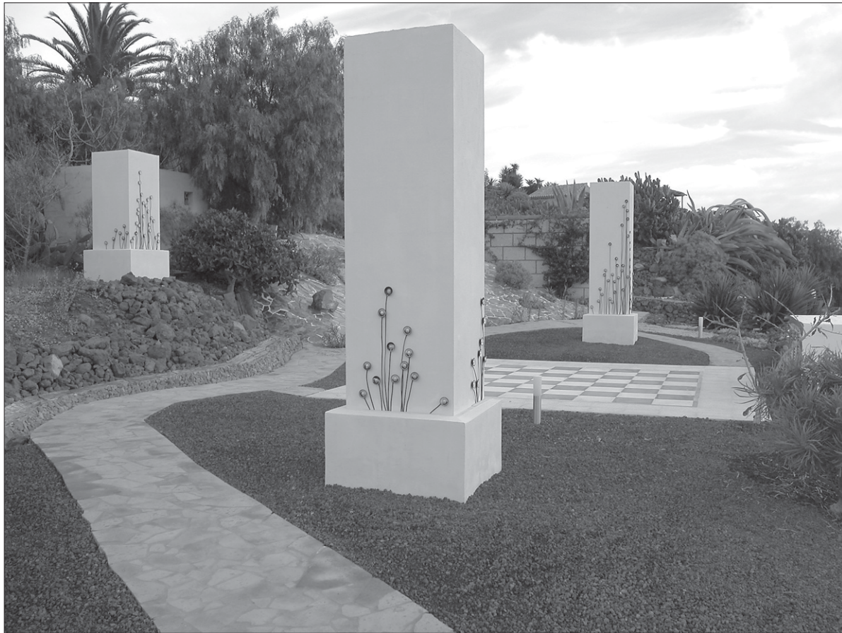
Robin Minard, Silent Music (2002), Mariposa-Projekt, Ténérife, Îles Canaries.