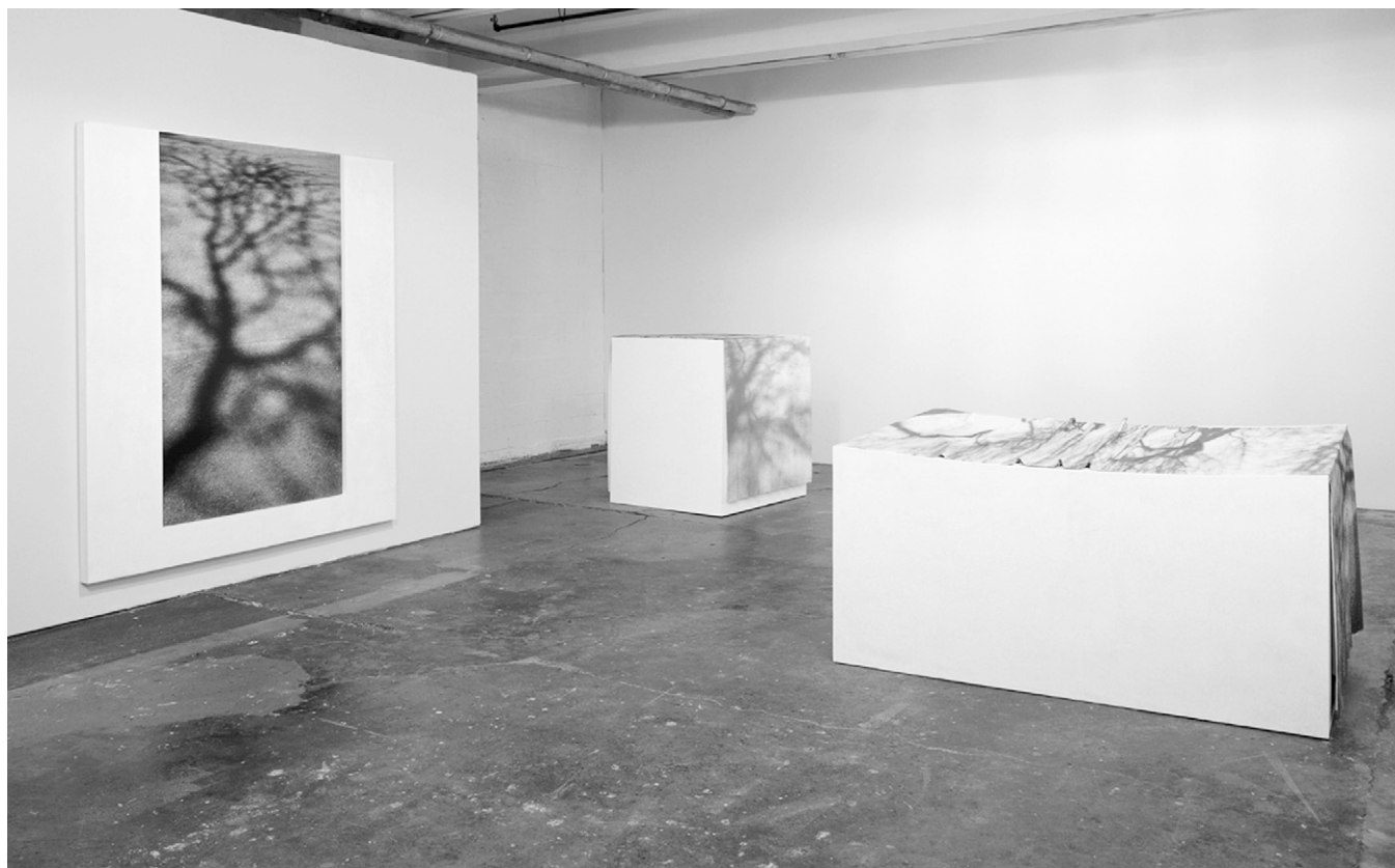
«Installation1», Jocelyne Allouche, installation à l'atelier de l'artiste, œuvres de la série Monuments du funambule.