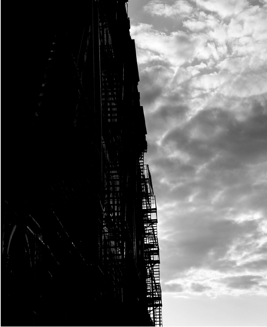
«Piegell_1», Jocelyne Allouche, Pièges II (n° VI), 2005, Impression au jet d'encre sur papier, Édition de 4, 118 cm x 89 cm.