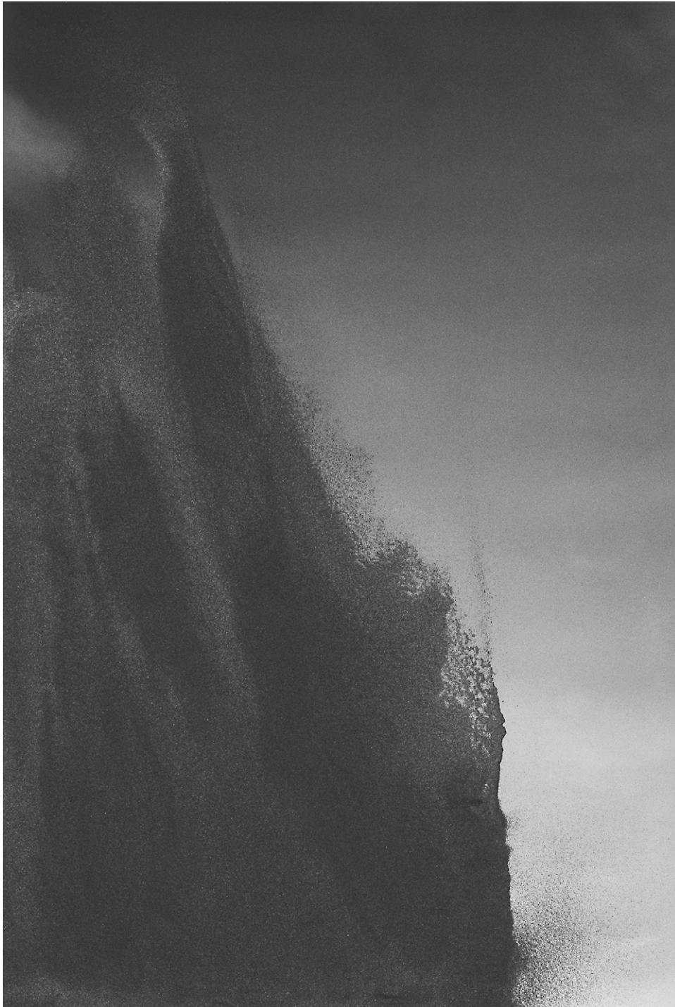
«Sable_16», Jocelyne Allouche, Vagues, 2006, Impression au jet d'encre sur aluminium et polyester, 218,5 cm x 147,5 cm.