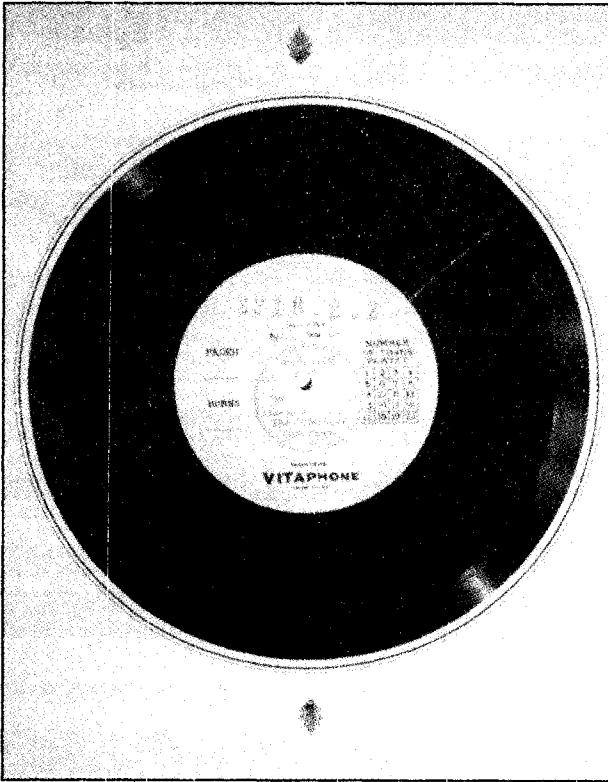
Illustration 1. Disque Vitaphone de la piste sonore du film The Jazz Singer (Warner, 1927)

d'abord un disque et relève donc de la phonographie. C'est justement ce que notait la critique de l'époque. Pour l'un des commentateurs, « Le film est un simple enregistrement de Jolson sur disque Vitaphone élargi » (Spargo). « Vous voulez ma définition d'un film parlant?, demande un deuxième, c'est un disque phonographique fortement amplifié » (Ennis, p. 43).