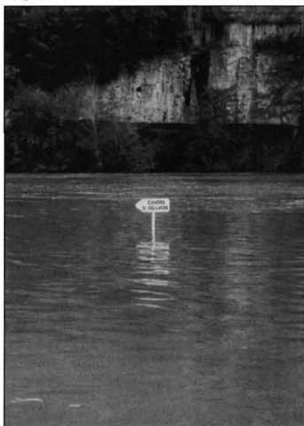
Figure 4 Crue du 15 août 1993 (Lot)

de Lalevade. Moins d'un an plus tard, le 7 juillet 1993, une centaine de campeurs doit être évacuée d'urgence dans le Villenois; le 15 août, une crue du Lot entraîne l'évacuation de 500 campeurs (figure 4). Le 27 avril 1998, les débordements du Cher et de l'Allier dans la région de Montluçon obligent les sapeurs-pompiers à évacuer un campement de personnes nomades à Yzeure et les caravanes stationnées dans quatre campings. Le 18 janvier 1999, une crue du Gapeau dans la région d'Hyères entraîne l'évacuation de 150 personnes; en période estivale, plusieurs centaines de campeurs auraient été directement menacés. Les espaces réservés aux populations exogènes et particulièrement nomades, premières victimes des catastrophes naturelles, seraient pour une bonne part, dans une géographie analogique ou symbolique chrétienne, situés dans les zones défortunées, impropres aux activités humaines et éminemment risquées : dans les couloirs des cours d'eau où sévissent le Gran Trein et la chasse volante, dans les cônes de déjection hantés par les dracs, aux confluences et dans les zones inondables où sommeillent les dragons, au pied des montagnes habitées par les diables. « De nuit, il ne vaut mieux pas passer sur le pont à Aproz. Le gran trein descend le long de la Printse » déclare encore en 1959 l'interlocutrice de l'ethnologue Rose-Claire Schüle, à Nendaz (Schüle, 1992 : 285).