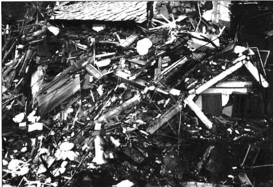
Figure 8 Glissement d'une maison dans la vallée de Cogne (octobre 2000)

Nous nous sommes dégagés du risque reconnu pour réaliser une enquête de localisation portant sur un échantillon de 1804 campings, que nous nous sommes essayé à comparer avec la perception de