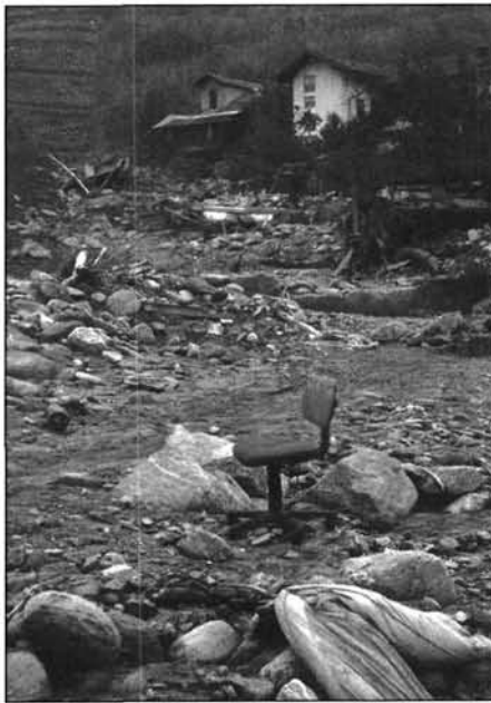
Figure 7 Torrent Saint-Barthélémy