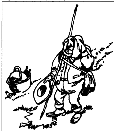
Figure 10 Pique-nique raté, détail

population concernée assumerait consciemment les conséquences. L'argument serait théoriquement recevable si le critère économique n'intervenait pas fortement dans le choix de ce mode d'hébergement – d'où discrimination économique devant le risque – et si les procédures d'information étaient mises en œuvre, ce qui est rarement le cas.