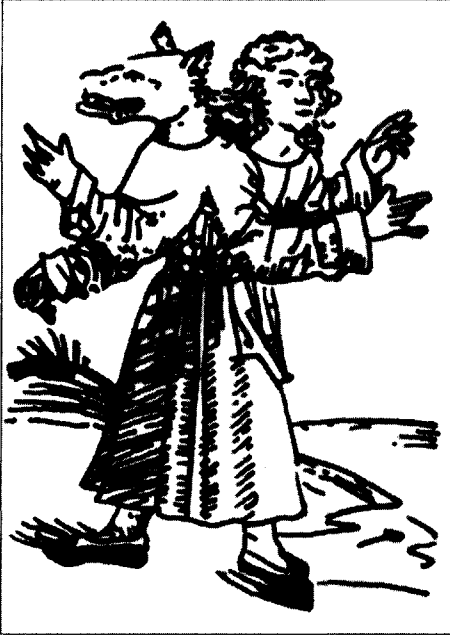
Figure 2 Monstre hybride

(Sexta etas mundi, folio CXCVIII recto).