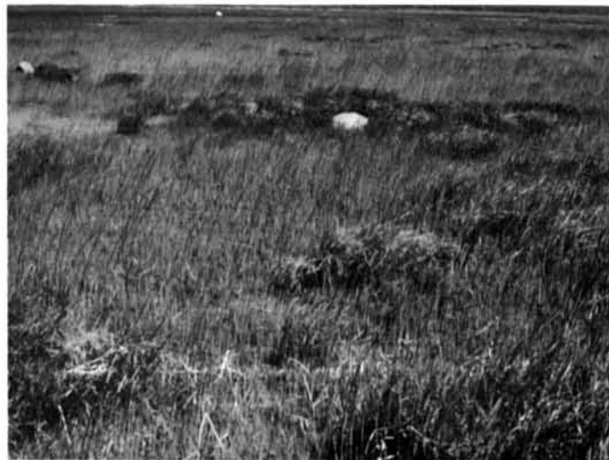
Photo 16 Radeaux de schorre à la surface d'un schorre à scirpes près de Fort Rupert (78°48' W ; 51°28' N). 24.6.75.

A Scirpus tidal marsh near Fort Rupert (78°48' W ; 51°28' N) showing numerous peat blocks and a few scattered ice-drifted boulders. 6.24.75.