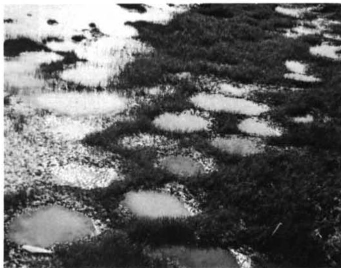
Photo 6 Mare remplie d'eau dans la partie supérieure du schorre à la pointe de Fiedmont, près d'Eastmain (78°32'30" W ; 52°16' N). À remarquer les parois raides et le tracé irrégulier indiquant une déchirure du tapis végétal et minéral par les glaces. 24.4.74.

Photo 5 Petites dépressions circulaires dans un schorre au sud de la pointe à l'Ours-Noir, rive ouest de la baie de Rupert (78°58' W ; 51°26' N). Ces dépressions correspondent peut-être à des cuvettes d'affouillement, mais semblent plutôt d'origine anthropique : elles auraient été faites par les chasseurs qui utilisent parfois des mottes de terre qu'ils recouvrent de papier ou de plastique ou de tissu blanc pour attirer les oies. 22.6.75. Small circular depressions in the tidal marsh, south of Black Bear Point, west shore of Rupert Bay (78°58' W ; 51°26' N). If natural these depressions were made by ice cakes ; if not, they are probably holes produced by the digging out of earth blocks which are used as decoys by geeses' hunters. 6.22.75.