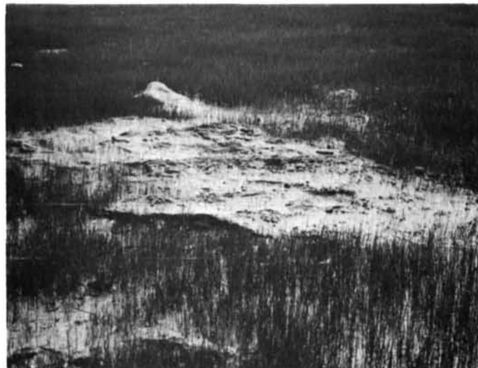
Photo 14 Cercle de débris glaciels construit sur le lieu de fonte d'un radeau de glace à la surface du schorre de l'anse de Hall, baie de Rupert (78°56'30" W ; 51°41' N). 6.23.75. An ice-drifted debris circle built by an ice floe upon melting at the surface of a tidal marsh, Hall Cove, Rupert Bay (78°56'30" W ; 51°41' N). 6.23.75.

Photo 13 Îlot de débris minéraux (argile, vase et cailloux) abandonnés sur le lieu de fonte d'un radeau de glace dans un schorre de la rive ouest de la baie de Rupert, au sud de la pointe à l'Ours-Noir (78°58' W ; 5°26' N). 22.6.75. A patch of mineral debris (clay, mud and stones) left by an ice floe upon melting at the surface of a tidal marsh, west shore of Rupert Bay, south of Black Bear Point (78°58' W ; 51°26' N). 6.22.75.