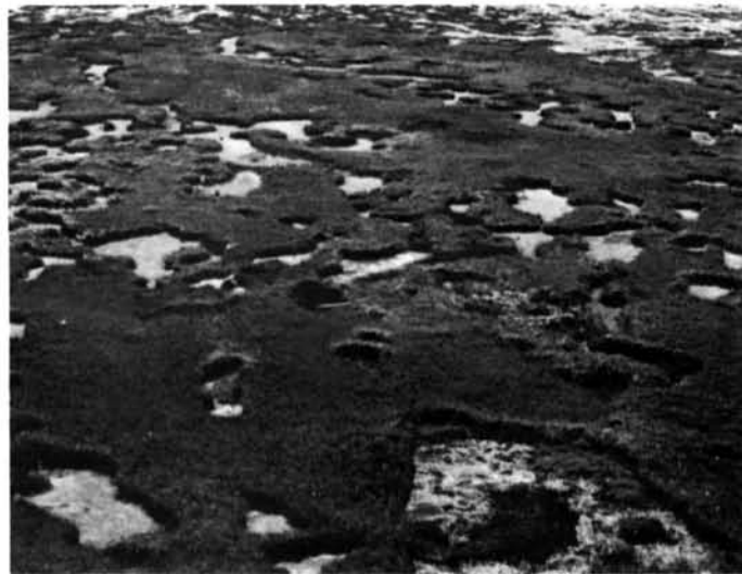
Photo 4 Vue détaillée d'un schorre à marelles au nord de l'embouchure du Missisicabi, rive orientale de la baie d'Hannah, Ont. (79°40' W ; 51°20' N). 26.6.75.

Oblique low altitude air-photo of the upper tidal marsh with ice-made pans, northern part of Hope Bay, south of Vieux-Comptoir (78°33' W ; 52°30' N). 7.24.74.