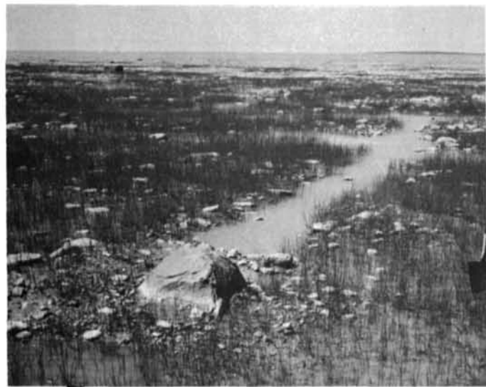
Photo 10 Longues rainures superficielles résultant de la trainée sur le fond de gros cailloux déplacés par les glaces du jusant, île Lemoine, secteur sud de la baie de Rupert (78°56' W ; 51°19' N). 24.6.75.

An ice-made furrow with an ice-push mound shoreward in the tidal marsh at Hall Cove, Rupert Bay (78°56'30" W ; 51°41' N). 6.23.75.