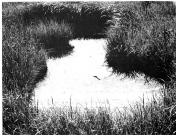
Photo 8 Dépression circulaire avec bourrelet périphérique dans le schorre inférieur produite par l'affouillement d'un radeau de glace, anse de Conn, au nord d'Eastmain (78°32' W ; 52°18' N). 24.7.74.

A dry bottom depression with vertical walls and cornices, and a muddy bottom with an ice-drifted boulder, in the tidal marsh of Hope Bay, south of Vieux-Comptoir (78°33' W ; 52°30' N). 7.24.74.