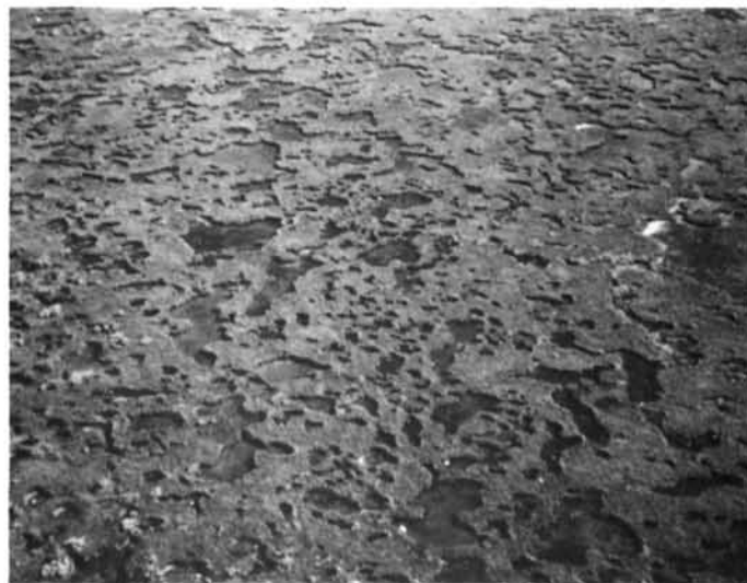
Photo 2 Partie inférieure d'un schorre à marelles dans la baie d'Espoir, au sud de Vieux-Comptoir (78°32'30" W ; 52°27' N). 24.7.74

Oblique air-photo of the upper marsh with numerous ice-made depressions, at Fiedmont Point, near Eastmain (78°32' W ; 52°16' N). Note the great variety of shapes and dimensions of pans. 7.24.74.