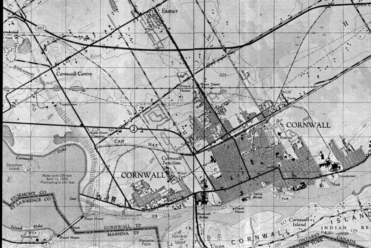
Figure 1 Extrait de la carte au 1:50,000 (feuille 31 G/9), faisant état de la situation locale vers 1962.