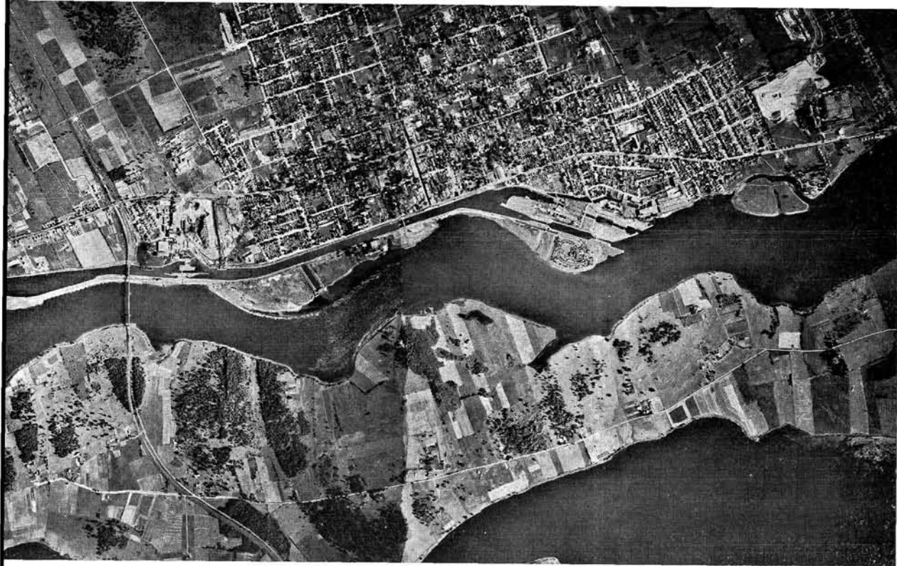
Photo 2 Vue aérienne de Cornwall, prise le 27 juillet 1946. La partie aval du canal de Cornwall, avec trois écluses visibles, fait écran entre la ville et le bras nord du fleuve. Les trois principales industries sont déjà bien installées à cette date : le moulin à papier à l'Ouest, le complexe cotonnier au bord du fleuve, et immédiatement à l'est des deux premières écluses du canal de Cornwall, enfin les usines Courtaulds (avec des travaux d'agrandissement en cours), à l'Est. L'extension urbaine n'a guère dépassé les deux dernières usines, qui se trouvent alors en position périphérique par rapport à l'agglomération.