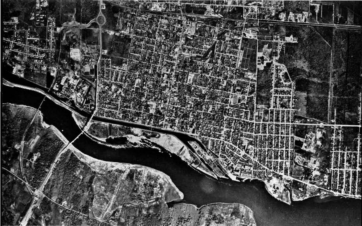
Photo 3 Vue aérienne de Cornwall, prise le 15 mai 1964. L'extension urbaine est considérable, à l'Ouest, au Nord et à l'Est, de sorte que le moulin à papier et les usines Courtaulds sont désormais enfermés à l'intérieur de la ville, et entre des quartiers de résidence. L'aménagement du fleuve n'est guère perceptible sur ce cliché (voir la carte n° 1). Cependant, un nouveau pont international a été construit, et surtout le bras septentrional du fleuve a été modifié dans son tracé.

tional. 22 Sa hauteur est telle que sa rampe d'accès part de la Septième Rue, coupant ainsi la ville en deux, dans la direction nord-sud ;