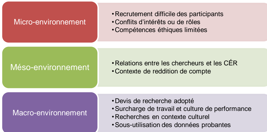
Figure 1. Les enjeux éthiques de la recherche en santé selon les écrits recensés