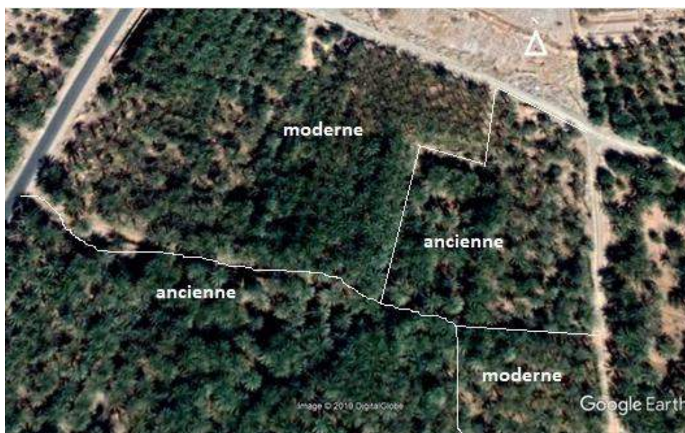
Figure 5. Physionomie d'une palmeraie mixte