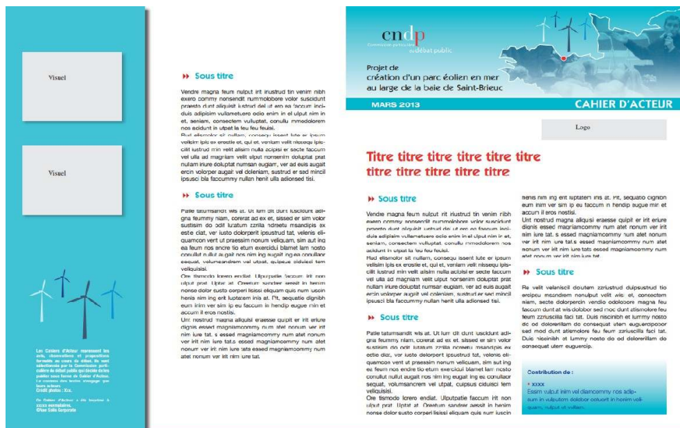
Figure 1. Maquette Cahier d'acteur.