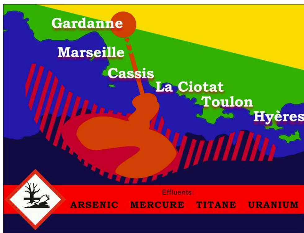
Figure 5. Affiche Anti-boues rouges, rassemblement Luminy, septembre 15.