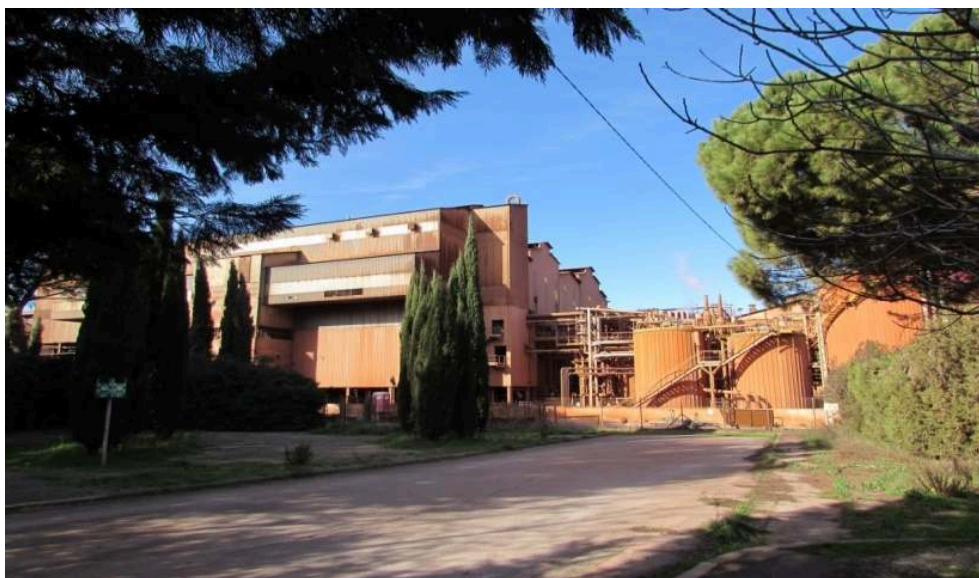
Figure 1. L'usine Altéo Gardanne, octobre 2015.