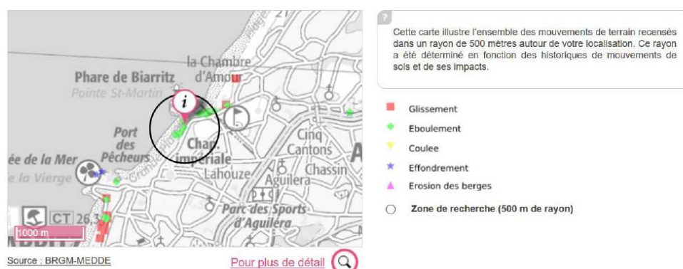
Figure 4. Visualisation des aléas côtiers dans l'interface Géorisques .

« mouvement de terrain » cartographie précisément la localisation des aléas, mais malheureusement l'onglet « pour plus de détails » n'aboutit pas.