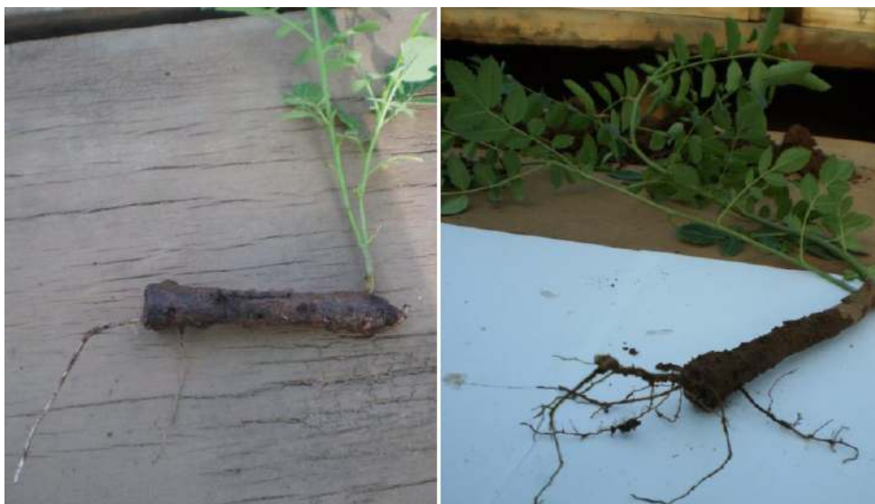
Figure 1. S. birrea - boutures de segment de racine faiblement enracinées : en position horizontale (à gauche) et verticale (à droite), 7 mois environ. /Figure 1. S. birrea - root cutting weakly rooted : horizontal position (left) and vertical position (right), about 7 months.