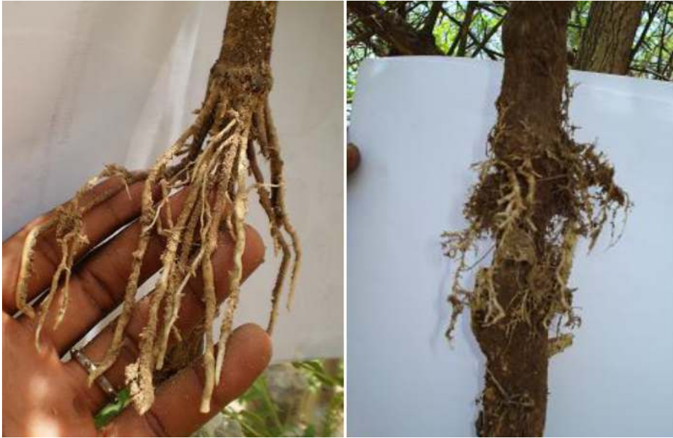
Figure 2. Marcottes aériennes médianes de S. birrea (à gauche) enracinée après 6 mois et de B. aegyptiaca (à droite) enracinée après 3 mois./Figure 2. Median air layering of S. birrea (left) rooted after 6 months and B. aegyptiaca (right) rooted after 3 months.