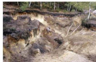
Les arbres basculés entraînent des « paquets » de sol lors de leur chute