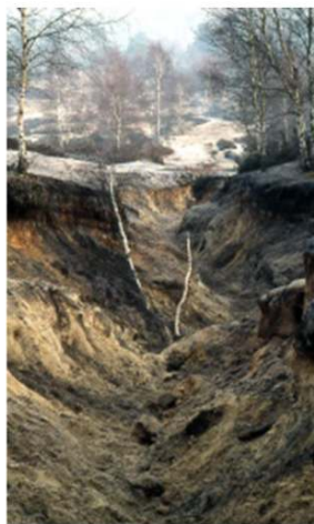
Blocs de grès basculés dans le ravin