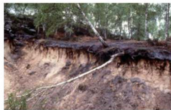
Arbre entrain de basculer