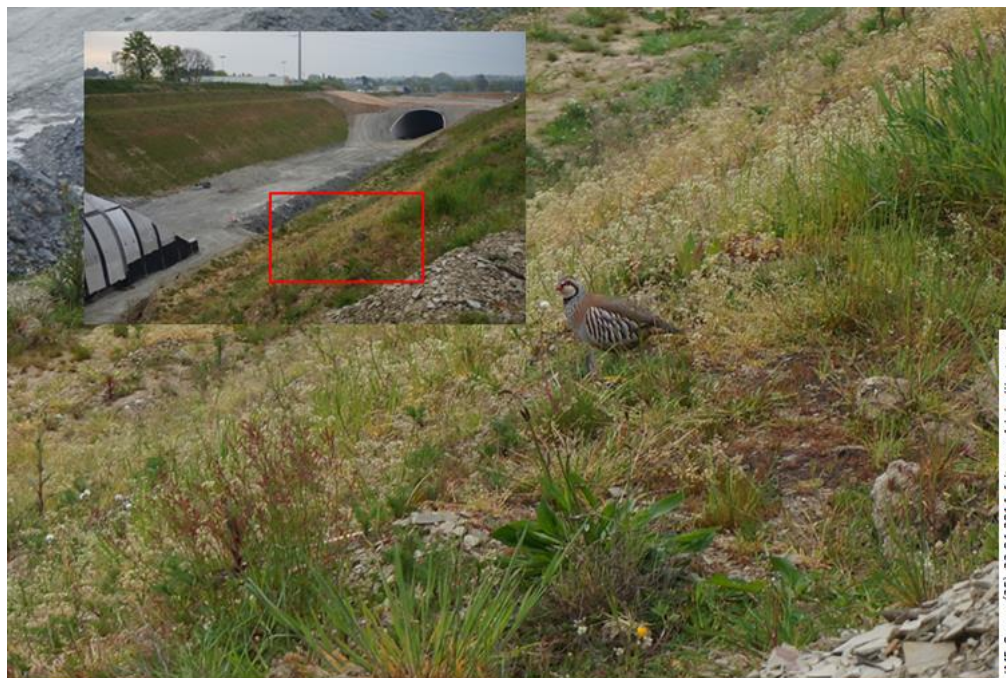
Figure 2. Perdrix rouge ( Alectoris rufa ) sur un déblai reconquis par la végétation (chantier de la LGV-BPL) / Red partridge ( Alectoris rufa ) on vegetated backfill (LGV-BPL construction site)