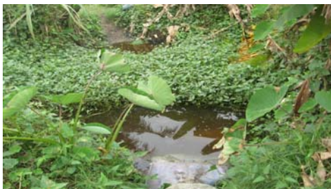
Figure 8. Puits à fleur du sol sur la voie de l'aéroport

Par ailleurs, il nous a été donné de constater par endroits, l'existence de puits à fleur de sol (cf. figure 8) sur des sites