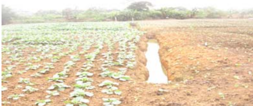
Figure 7. Eau d'arrosage dans une unité de production à côté de l'école SOS d'Abobo.