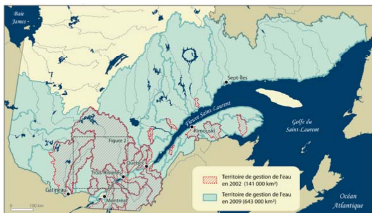
Figure 1. Les territoires de gestion de l'eau au Québec, 2002 et 2009.