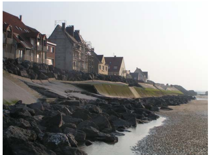
Figure 4.. Digue de Wissant éventrée, vue à marée basse