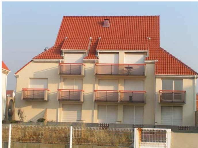
Figure 5. Aperçu du taux d'occupation des logements du front de mer à Wissant, le 27 mars 2007 à 18h30 Sources : V. Herbert, 27 mars 2007