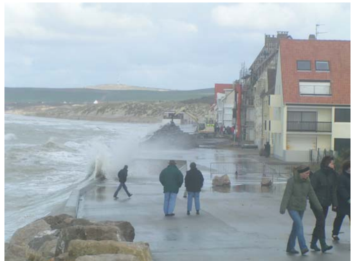
Figure 3. Submersion de la digue de Wissant le 21 mars 2007

La première alerte vraiment visible pour l'ensemble de la population, date du mois d'avril 2000, où la digue initiale, reposant sur des poches d'air, s'effondre. Les acteurs locaux semblent avoir pris conscience du problème. L'association locale « Les amis de Wissant » suit ainsi avec intérêt les travaux de réfection de la digue. Certains membres de l'équipe municipale participent par ailleurs activement aux réunions annuelles de l'EUCC-France ( European Union for Coastal Conservation ).