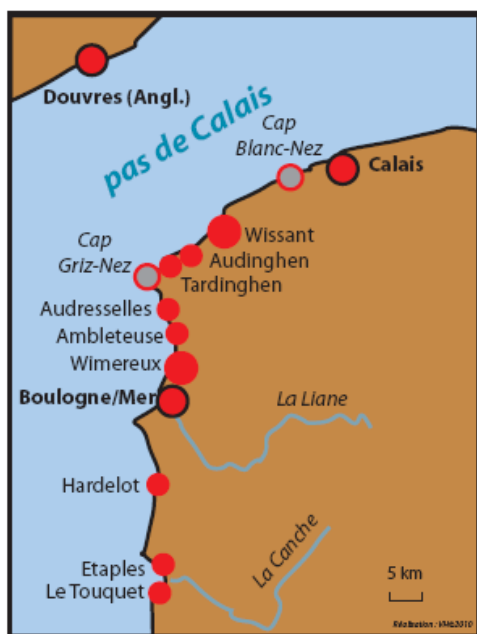
Figure 2. La Côte d'Opale, entre Boulogne-sur-Mer et Calais

Les questionnaires ont été effectués, pour la plupart, sur les digues et dans les rues des stations balnéaires (sortie des magasins, par exemple, permettant d'avoir une plus grande probabilité de rencontrer des personnes habitant le lieu d'étude). Le « porte-à-porte » s'est effectivement révélé peu productif. Comme indiqué supra , la majeure partie des personnes questionnées habitait Wimereux (45,8 %) ou Wissant (16,7 %).