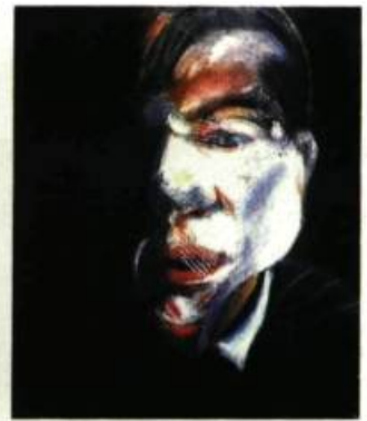
Three Studies for a Self-Portrait, 1980 Huile sur toile Metropolitan Museum of Art, New York