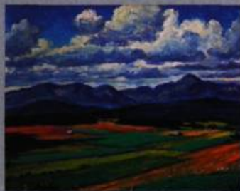
Gordon E. Pfeiffer August Day, Farmlands in Charlevoix, 1942 Huile sur toile 75 x 91 cm Collection Musée Bruck, Ville de Cowansville

► MUSÉE DE CHARLEVOIX 10, chemin du Havre, La Malbaie Tél.: 418 665-4411 www.museedecharlevoix.qc.ca Horaire estival – 9 h à 17 h tous les jours Visites commentées disponibles