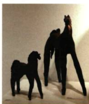
Sara Mills Grand cheval (40 cm), 2008 Petit cheval (25 cm), 2008 Poterie