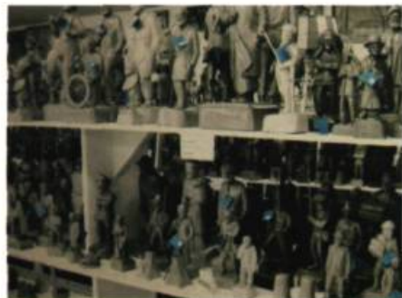
Ji-Sun Shin Les colliers verts , 2008

Véritable hymne à la carte postale et soulignant le centenaire de la Traverse Rivière-du-Loup/Saint-Siméon, Rivière-du-Loup à la carte - Le Volet maritime présentera dans le hall d'entrée du Musée, des cartes postales à la vocation maritime en grand format. Photographie et art postal, un duo vecteur de transmission d'une réalité historique ou simple image d'Épinal? À vous de le découvrir! GZ et MPB