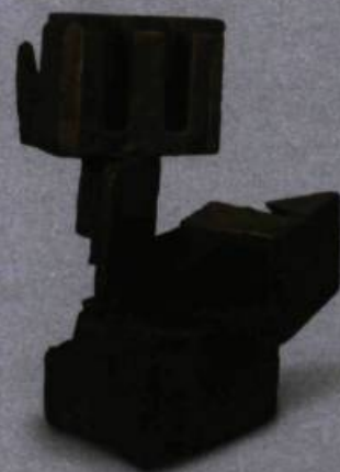
Chez moi , 1975 Bronze 56 x 46 x 15 cm Collection du Musée du Bas-Saint-Laurent

Note: Armand Vaillancourt sera présent le dimanche 16 août à 14 h lors de la Journée gatinoise de la diversité culturelle pour parler de son travail. GZ