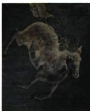
Frank Chatel Je peux marcher dans les eaux profondes, 2007 Acrylique sur toile 163 x 130 cm

En juillet, l'exposition Équus , en collaboration avec l'Internationale de Bromont, ravira ceux qui ont une passion pour l'animal qui représente depuis la nuit des temps la beauté et la force: le cheval. Frank Chatel, Octavio Gonzalez, Lagaan, Sara Mills, Louisa Nicol et Ruben Ramonda présentent une quarantaine d'œuvres (peinture, sculpture, dessin, céramique). MGB