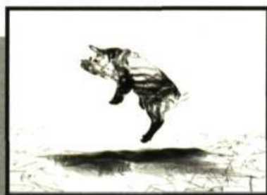
Michel Boulanger Champ témoin (détail), 2008. Film d'animation 3D numérique, 2 mn en boucle

et en collaboration avec la Biennale internationale d'estampe contemporaine, Emballer le banal a comme objectif de redéfinir le patrimoine québécois dans un contexte contemporain. En effet, l'utilisation de la courtepointe (symbole traditionnel québécois) par les artistes, qu'il soient locaux ou étrangers, permet de revisiter le folklore de façon moderne et de l'insérer dans un contexte actuel. Les œuvres réalisées en tissu recyclés serviront à emballer des objets du centre-ville (bancs de parc ou boîtes aux lettres!) et à créer un véritable happening avec le public! Un événement qui ne semble pas banal du tout!