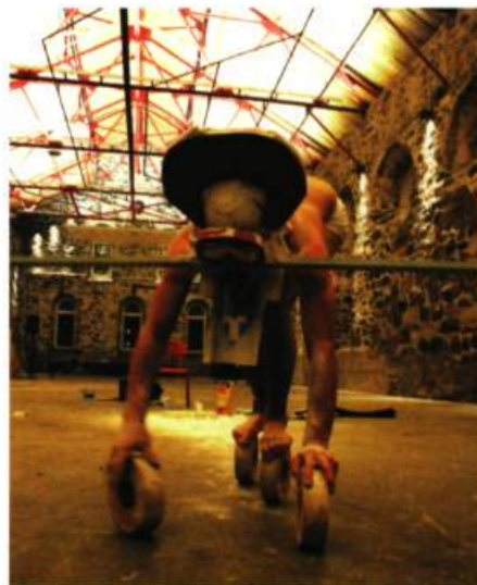
ART NOMADE 2007 Francis Arguin

À cette programmation se greffent plusieurs activités satellites dispersées au Québec grâce à la collaboration d'autres centres d'artistes: Espace Virtuel (Chicoutimi), Langage Plus (Alma), le Musée amérindien de Mashteuiatsh, Le Lieu (Québec), la Galerie Horace (Sherbrooke), le Regroupement des arts interdisciplinaires du Québec (Montréal) – qui seront les hôtes de soirées de performances, de conférences ou de micro-résidences au cours des semaines suivant la programmation officielle du festival. Il faut encore mentionner plusieurs happenings dans les établissements d'enseignement supérieur de la région du Saguenay-Lac-Saint-Jean qui participent à l'événement. De cette façon, Art nomade ne se limite pas au travail d'artistes en perpétuelle migration: le festival va lui-même à la rencontre du public pour faire découvrir cet art toujours un peu méconnu qu'est la performance. JFC