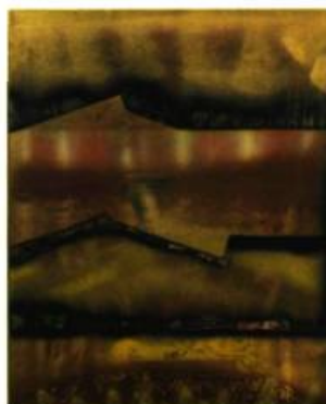
Pierre Gauvreau Les larmes de la nuit , 2008 Techniques mixtes sur toile 61 x 61 cm © Gauvreau/Sodrac 2009 Photo: Daniel Roussel

PIERRE ET ANNICK GAUVREAU. PAPIERS D'IDENTITÉ Du 20 septembre au 1 er novembre 2009