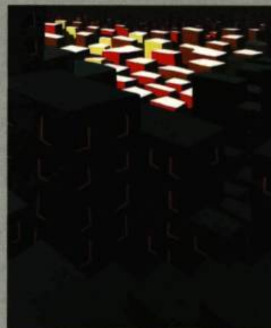
Jocelyn Blouin En banlieue des banlieues, 2008 Huile sur toile 91 x 75 cm

Pour souligner le talent d'un(e) artiste émergent(e) de la grande région métropolitaine de Québec, la galerie a instauré le Prix L'espace contemporain ; il sera octroyé tous les deux ans. Ce prix comprend une bourse de 500$ remis par Marc Bellemar, fondateur du Club des collectionneurs de Québec; de plus, le lauréat ou la lauréate se verra offrir une exposition solo à L'espace contemporain en mars 2010. Le nom du premier lauréat sera dévoilé à l'automne 2009. D'ici là, le public est invité à assister au dénouement de l'événement via le site internet officiel de la galerie. MPB