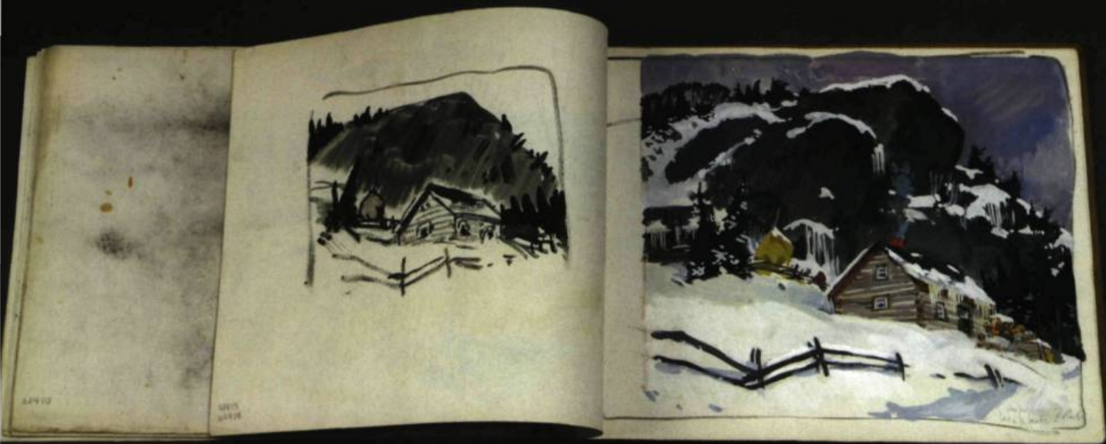
Carnet Québec 1948-1949, Lac à la loutre - Maison l'hiver et Maison sous la neige, 1949 Dans un carnet relié par l'artiste, encre de Chine et gouache sur papier vélin, 25,1 x 32,7 cm chaque Atelier Frédéric Back. Inv. 02414-02415

ses écrits. En la voyant, je l'ai trouvée tellement belle! Nous allons fêter bientôt nos 60 ans de mariage! Notre voyage de noces à travers le Canada m'a donné l'occasion de dessiner des images uniques de ce pays alors presque sauvage. Aujourd'hui, ma femme est paralysée. Je passe mes journées auprès d'elle. Je fais tout ce que je peux pour lui alléger cette souffrance...