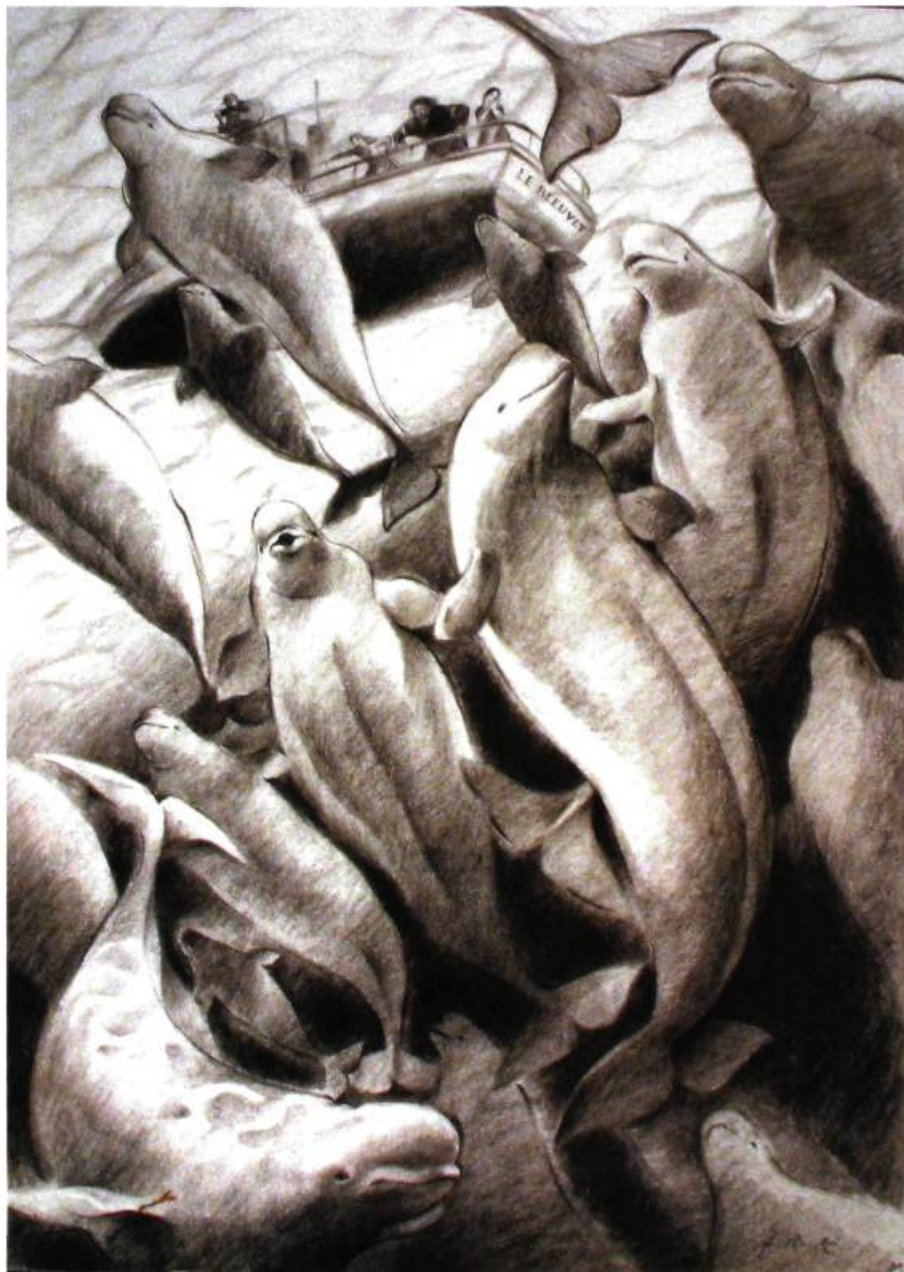
Les bélugas – planche 2 pour Les bélugas ou L'adieu aux baleines , 1996 Crayon de couleur sur papier vélin, 41,2 x 29,3 cm Pierre Béland, Éditions Libre Expression, Montréal, 1996 Collection Loto-Québec. Inv. 31045

que la ville était occupée par les Allemands, Mathurin Méheut est arrivé. Avec lui, j'ai découvert la couleur. Il donnait un sens à ce qu'on faisait. La considération n'existait pas toujours pour les élèves à ce moment-là. Mathurin Méheut, au contraire, nous accordait toute son attention.