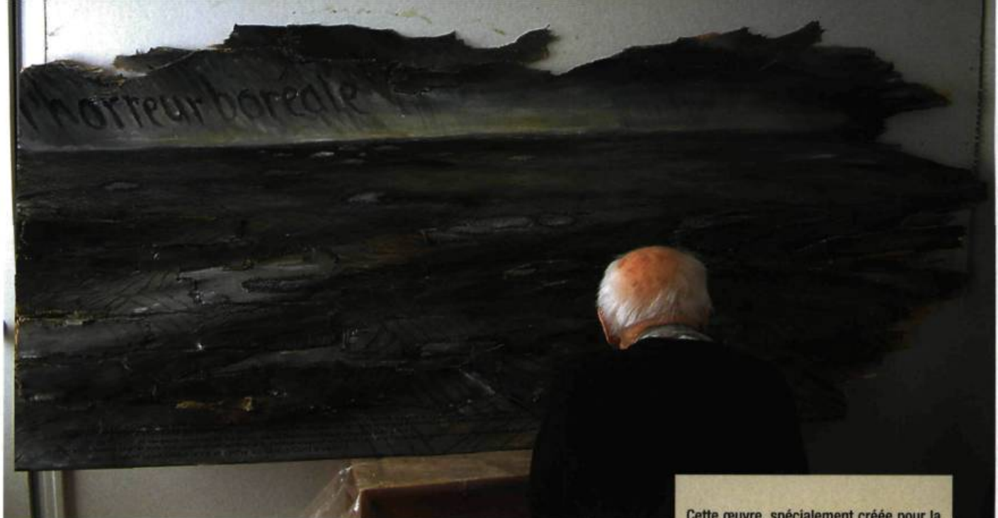
L'horreur boréale , 2009 Acrylique, crayon de couleur, pastel et crayon feutre sur contreplaqué Collection particulière Atelier Frédéric Back. Inv. 30109

Cette œuvre, spécialement créée pour la présente exposition, a pour but d'inciter les gens à dénoncer les abus des compagnies forestières à travers le monde. Elle représente la forêt boréale telle que l'a vue Frédéric Back en 1998 lors d'un vol de Vancouver à Montréal. Cette vision cauchemardesque le hante depuis. Aujourd'hui, il est possible d'agir! Il suffit de s'inscrire au groupe La Société de l'homme qui plantait des arbres sur Facebook.