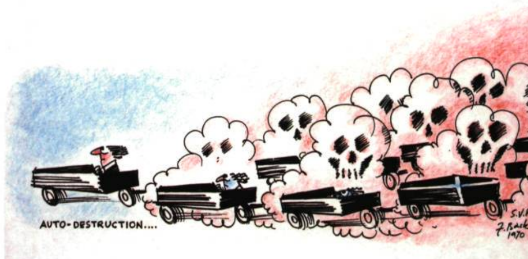
Auto-destruction , 1970 Photocopie du dessin original au crayon de couleur sur papier vélin, 21,5 x 28 cm Réalisée pour la Société pour vaincre la pollution (SVP) Atelier Frédéric Back. Inv. 30000

Il y avait le groupe des Sept, Emily Carr... et Pellan. Il y avait aussi les automatistes qui refusaient la représentation de la réalité. À Radio-Canada, j'étais dans le réalisme documentaire. Je devais donner le plus possible d'informations sur les animaux, sur les insectes, sur les plantes... On ne pouvait rien laisser au hasard.