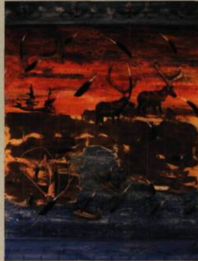
Jean St-Onge Kamishata-Kushpit (Les nomades) , 2006 Teinture, sable ferreux, plumes d'outarde, andouillers de caribou, bois de plage sur contreplaqué d'épinette 2,5 x 3,7 m

Sept-Îles—Impressions du territoire—Parcours de 12 artistes septiliens