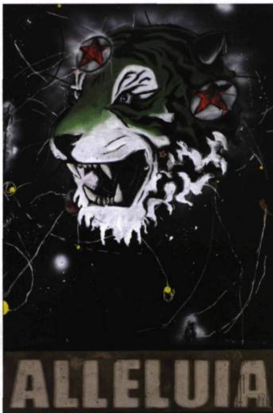
Sylvain Bouthillette Alleluia, 2007 Techniques mixtes 187 x 126 cm

Le résultat des activités de collecte d'Alain Tremblay semble de prime abord assez hétéroclite, voire chaotique. Plusieurs œuvres se côtoient plus ou moins harmonieusement. Toutefois, le titre Sublime Démesure , particulièrement bien choisi, donne quelques pistes d'appréciation qui réintroduisent du sens dans une désorganisation qui