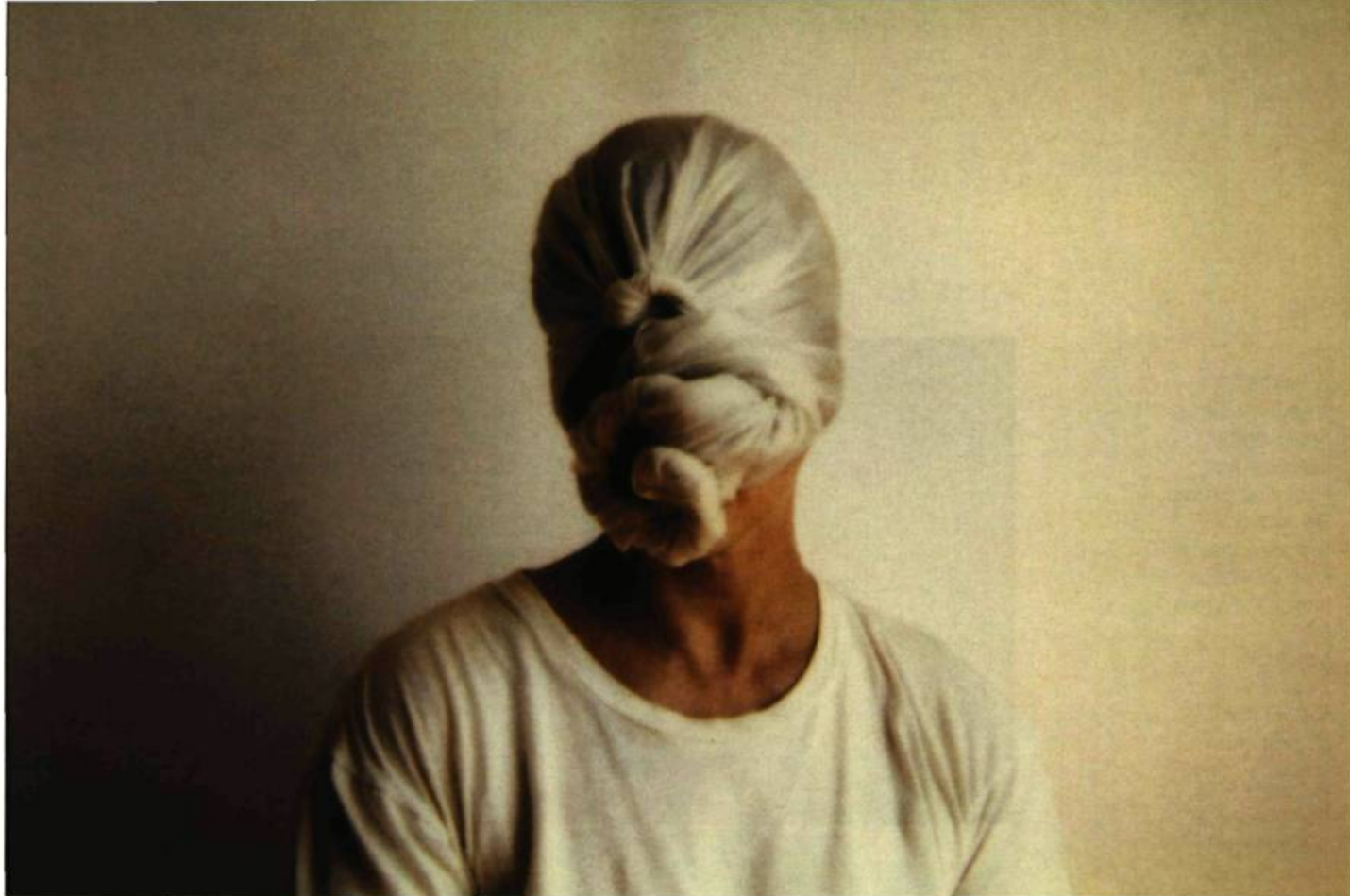
Nicole Jolicœur Déprises II , 1999 Épreuves numériques, 1/2 (11 épreuves) 54 x 76 cm (chaque élément) Musée national des beaux-arts du Québec. Achat grâce au Programme d'aide aux acquisitions du Conseil des Arts du Canada (2008.03)

à voir des productions d'artistes de toute génération qui ont marqué la ville à leur manière et dont les œuvres suivent les axes principaux de l'art actuel tel qu'il s'exprime, à tout le moins, à l'échelle du Québec. Les thèmes organisateurs de l'exposition (« La belle vie, la belle époque », « Du bric-à-brac au baroque », « La résonance des corps » et « L'état des lieux »), offrent des clés de lecture possibles au visiteur, justifient le choix des œuvres réparties dans les salles et permettent de percevoir les enjeux dominants, notam-