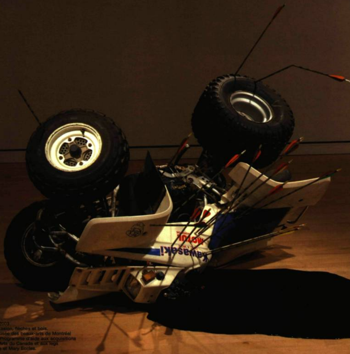
BGL Jouet d'adulte, 2003 Motoquasi d'occasion, flèches et bois. Collection du Musée des beaux-arts de Montréal Acheté grâce au Programme d'aide aux acquisitions du Conseil des Arts du Canada et aux legs David R. Morrice et Mary Eccles.