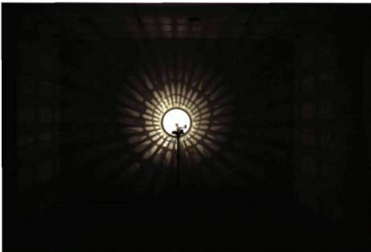
Diane Landry Mandala Naya , de la série Le Déclin bleu , 2002 Installation. Bouteilles de plastique, panier à lessive, trépied, moteur, aluminium, bois et éclairage halogène 100 x 100 x 50 cm (le dispositif); dimensions variables (la projection) Musée national des beaux-arts du Québec Achat (en cours d'acquisition) (A 2008.62)