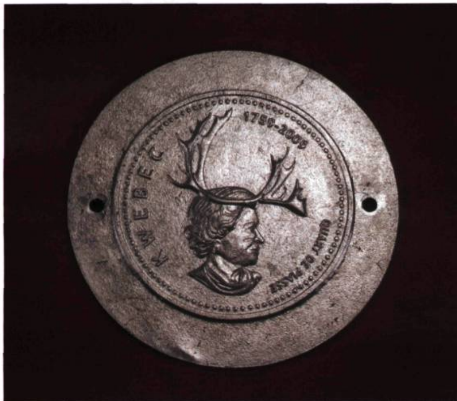
Martin Bureau Hommage à Sa Gracieuse Majesté , 2008 Fonte et feuilles d'aluminium, 3/5 58 cm (diam.) x 3,5 cm (épais.) Prêt de l'artiste