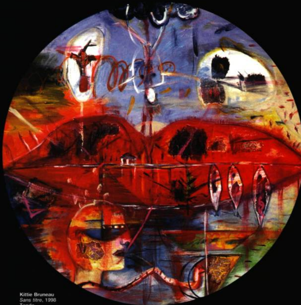
Kittie Bruneau Sans titre, 1998 Tondo Acrylique sur toile D 120 cm

TROIS EXPOSITIONS MAJEURES VONT METTRE EN VEDETTE LA COLLECTION D'ŒUVRES D'ART