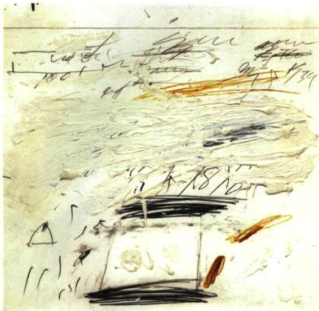
Poems for the Sea , 1959 Peinture de maison, craie de cire, crayon, crayon à mine sur papier. 24 feuilles, 33 x 31 cm environ pour chacune