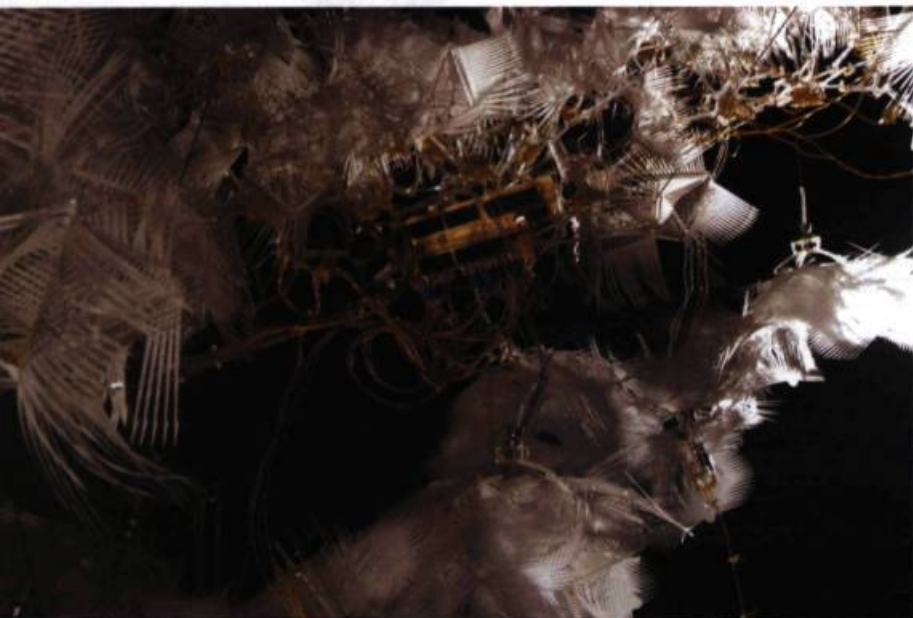
Philip Beesley Implant Matrix (détail), 2006

entreprises sont associées à son nom: le cinéma Ex-Centris et le Studio Ex-Centris mais aussi Pixman, Pixnet, Media Principia et Digiscreen compagnies de production et de diffusion de médias numériques.