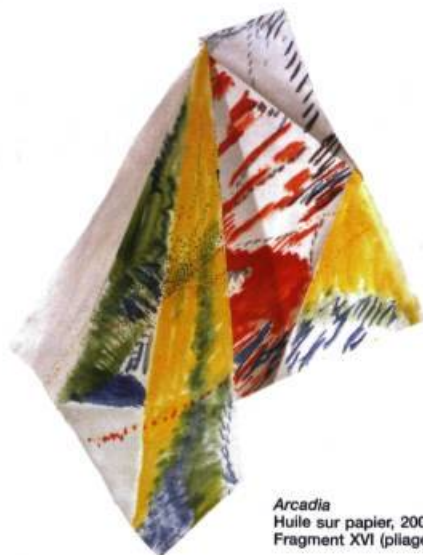
Arcadia Huile sur papier, 2006 Fragment XVI (pliage)

Le corps, c'est celui du modèle. Tenu pour la référence la plus fondamentale de la peinture jusqu'à l'abstraction, il est montré par Petry, Rondelli, Allen que, même réduit à n'être plus que « l'ombre de sa figure » ( Shadow Figure ), c'est encore lui qui dédimensionne la toile pour l'animer. Démonstration poursuivie par Running... où est ajouté le mouvement; dispositif mis en valeur par l'inversion des plans, coloré pour le fond, noir et blanc pour les corps en mouvement. Quant à l'identité du peintre, celle de Nancy Petry questionne trois éléments. Premier élément: l'histoire, avec sa ville natale Montréal, où elle trace un auto-portrait éphémère, sur la neige... Pour les deux autres éléments, elle utilise l'antinomie de l'eau (la neige) et du feu, en brûlant une