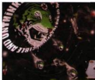
Sylvain Bouthillette Dharma Bum All Part of the Inexpressible and Unthinkable, 2005 Huile, peinture en aérosol et craie sur bois, 230 x 244 cm

aérosols et il tient dans sa main droite une épée levée tandis que sa main gauche expose au regard du spectateur un livre ouvert sur lequel celui-ci peut lire: « il n'y a pas de souffrance ... ils sont devenus des bouddhas manifestes ... ». Sylvain Bouthillette écrit à nouveau Tout est parfait sous l'image d'un cerf qui s'effondre blessé à mort. L'homme qui veut être heureux doit se libérer de la peur. Bee brave , tel est le conseil que donne l'artiste, avec l'humour du jeu de mots, dans un grand tableau où des abeilles volent autour d'un chapeau de clown qui flotte sur un fond noir où est gravé à plusieurs reprises le nom du célèbre moine bouddhiste tibétain Milarepa. Or, s'il est une peur dont il est difficile de se débarrasser, c'est bien celle de la mort. L'artiste propose donc de considérer la vie