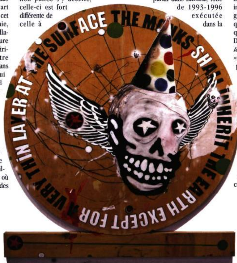
Sylvain Bouthillette RTH Except For, 2006 Huile, collage, fusain et peinture en aérosol sur bois, diamètre 210 cm Photo: Sylvain Bouthillette

tradition de la bad painting new-yorkaise des années 70. Un nuage de peinture noire porte une inscription dépourvue de sens, « MABEU », tandis que des fleurs vertes se haussent vers un ciel invisible. L'artiste a donné à de nombreuses œuvres des titres qui parodient le vocabulaire de la liturgie catholique, tournant ainsi indirectement en dérision une religion fondée sur le dualisme du bien qui serait d'ordre spirituel et du mal qui aurait partie liée avec la matière. Dans Hail to the allmighty green tara, n° 4 , l'artiste emploie le mot « Hail », qui introduit en anglais la prière à la Vierge Marie, pour saluer la corneille dont l'omnipotence est rendue manifeste par sa taille démesurée. L'oiseau se découpe sur un fond jaune où apparaissent, écrits en « bad writing » (si l'on me permet l'expression), Tsong Khapa, nom d'un grand réformateur du XIV e siècle de la tradition monastique tibétaine. Dans Gyrocompas , un lièvre sculpté suspendu la tête en bas, tel un martyr, tourne au-dessus d'un cercle de métal sur lequel est gravé