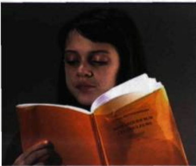
Exposition De l'écriture Gary Hill Vidéo