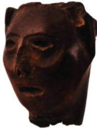
Pipes à masques Site Glenbrook, Ontario Musée canadien des civilisations, Gatineau