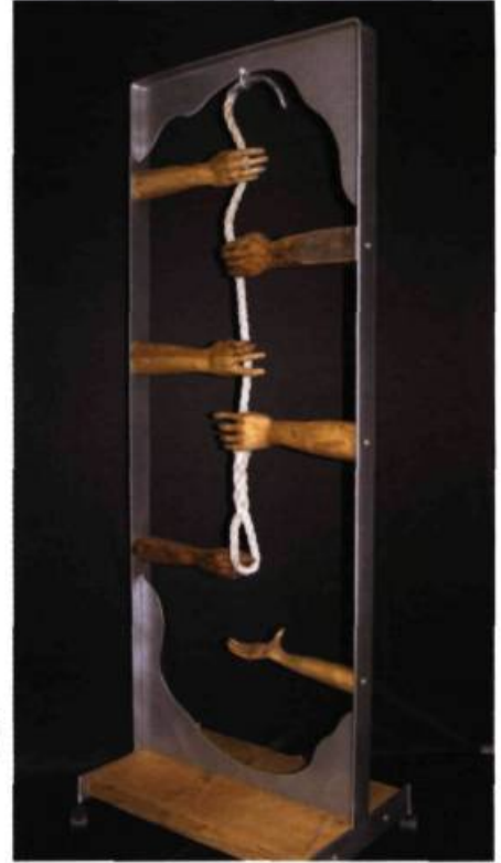
Dernière chance , 2005 Bois, métal et câbles 173 x 61 cm

à ce que je voulais.» Après avoir connu une carrière fructueuse dans sa spécialité, il abandonne l'exercice de la médecine en 1989. Il se consacre alors exclusivement à la sculpture. Au départ, il travaille le bois, surtout le cerisier d'automne et le tilleul dont il révèle le grain et les textures. Il se perfectionne aussi dans les techniques de fonderie sans pour autant se limiter à une façon de faire et à un matériau en particulier. Avec le métal, il s'exprime dans des formes géométriques de grandes dimensions: ses sculptures semblent pivoter sur elles-mêmes pour se laisser découvrir sous différentes facettes. «J'aime travailler à grande échelle. Je procède souvent par maquettes avant de faire usiner mes œuvres. Toute la difficulté consiste alors à décider dans quelles proportions agrandir. Épurées, quasi géométriques, ces formes très simples sont comme morcelées, décomposées et multipliées par des changements d'angles et par des torsions, un peu comme si la sculpture virevoltait sur elle-même. Cela donne des suggestions de mouvement.»