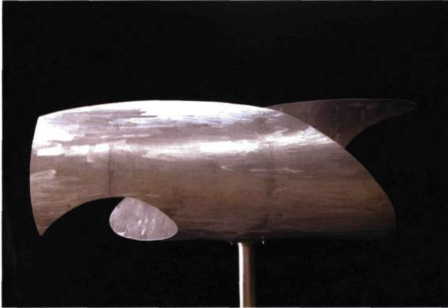
Oie blanche , 2002 Aluminium 152 x 64 cm