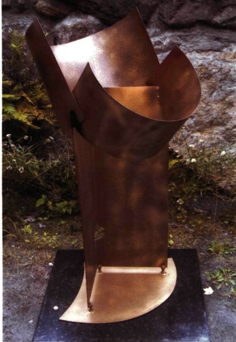
Ode à la joie, 1995 Métal doré 114 x 69 cm

tout droit de châteaux de preux chevaliers. D'autres proviennent des boutiques les plus cotées pour leur design. «Je bricole depuis l'enfance, dit-il. Du plus loin que je me souviens, j'ai toujours été un manuel mais avec une préoccupation esthétique. Le sentiment du beau a toujours été au cœur de ma vie. C'est ce qui a guidé d'abord le choix de ma profession. Je suis entouré d'œuvres d'art. Je ne peux vivre sans cet entourage. Ce qui compte pour moi, c'est la beauté de l'objet que je touche et avec lequel je vis. Mais aussi la beauté de la forme sculptée.»