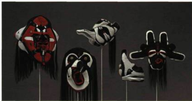
Vue de l'installation Prototypes (1998-2005)