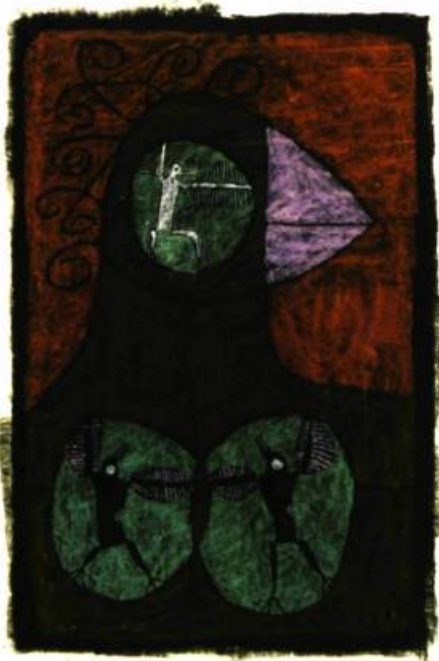
Sans titre, 1967 Pastel et encres sur papier 66 x 51 cm Collection particulière

Référence : Gérard Tremblay—L'invention d'un monde , Vie des Arts, automne 2003, no 192, p. 69-71.