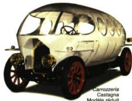
Carrozzeria Castagna Modèle réduit d'Alfa Romeo, 1913

Témoignage des discours philosophiques, économiques et esthétiques des différentes périodes qui ont marqué l'histoire récente de l'art et du design en Italie, l'exposition Il modo italiano regroupe près de 450 œuvres et couvre la période de 1890 à nos jours. S'offrent à nos yeux une panoplie de meubles, de sculptures, d'accessoires de cuisine et de peintures empreintes des traditions régionales et artisanales italiennes. En compagnie de designers inspirés, on découvre les œuvres étonnantes de cette période où le pays en forme de botte a su faire valoir l'essor remarquable de son savoir industriel et les audaces de ses innovations technologiques. MGB