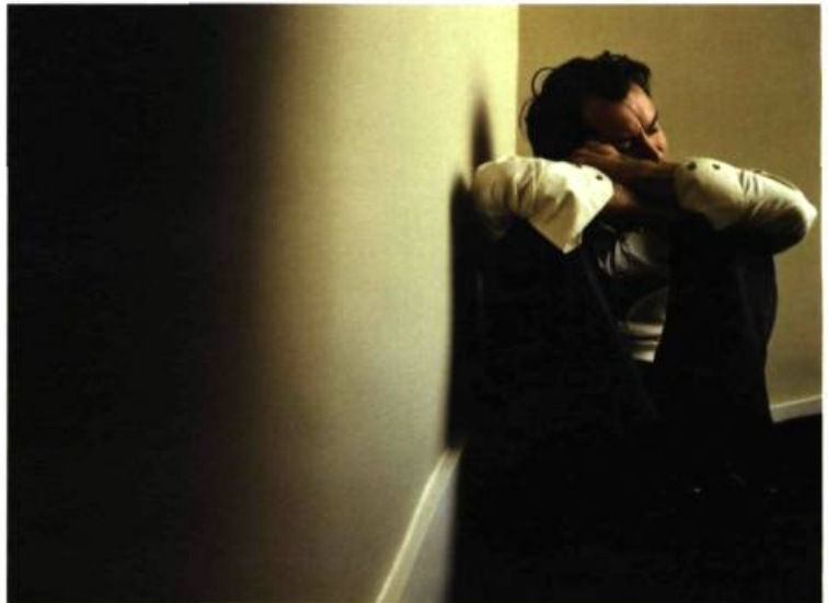
Sam Taylor-Wood Jude Law, 2003 C-Print 86,2 x 111,7 cm (incluant le cadre)

Il s'agit bel et bien d'autopourtraits, mais l'artiste renoue ici avec l'ingéniosité qui caractérisait ses œuvres des dernières années en trouvant encore une manière toute personnelle de renouveler le genre. En effet, personne ne pourrait s'y méprendre, il s'agit bien de Sam Taylor-Wood dans ces pho-