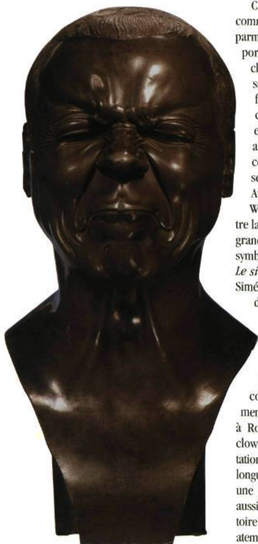
1- Franz Xaver Messerschmidt Un homme lugubre et sinistre Après 1770

ENTRE LE XVIII e SIÈCLE ET AUJOURD'HUI, LA FAÇON DON'T LES ARTISTES PERÇOIVENT LEUR PROPRE STATUT S'EST CONSIDÉRABLEMENT TRANSFORMÉE. LA FIGURE DU CLOWN ET SON UNIVERS FORAIN DEVIENNENT LES LIEUX PRIVILÉGIÉS DE CETTE TRANSFORMATION, EN PLUS D'OFFRIR DES MOTIFS QUI ROMPENT AVEC L'ESTHÉTIQUE ET LES CONVENTIONS ACADÉMIQUES.