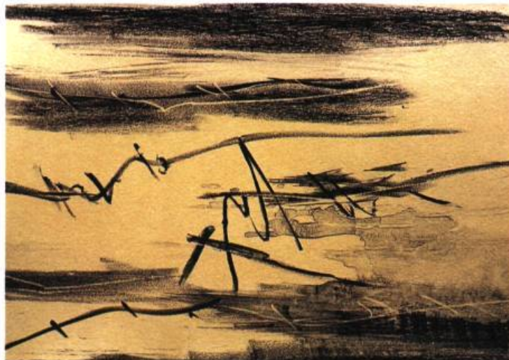
Sans titre, 2004 Lithographie 21 x 30 cm

À elle seule, une ligne brisée (récif? accroc?) éclabousse l'espace soudain liquéfié, si mobile, si changeant et si vague qu'il se confond avec la mer quand elle fusionne avec le noir, non de la nuit des temps, mais de la nuit du temps. Il suffit de voir. Là. Devant. Noir sur blanc. □