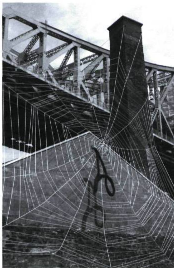
La demeure d'Arachnée, 2003 Sculpture géante composée de cordages tendus du pont Jacques-Cartier à la station de pompage Craig (Montréal).

trouve, en plus, qu'en français la Bible s'ouvre avec la lettre A pour entamer la phrase: «Au commencement...». L'écriture de Marc Lincourt fonde donc une écriture originelle, une écriture non du Commencement mais des commencements ou encore des recommencements. Si lire c'est relire et si écrire c'est récrire, alors voir c'est revoir. Il n'y a guère à lire chez Lincourt dont l'écriture n'engendre aucun texte mais produit une image,