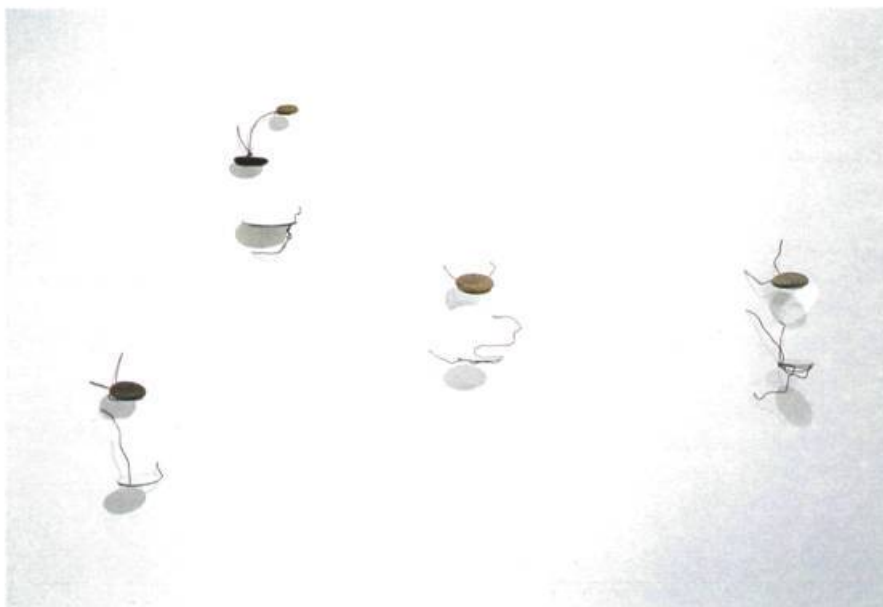
Vers , 2002-2003 (détail) Pierres et miroirs gravés, tiges d'acier 33 x 10 x 10 cm

EST UNE ENTREPRISE FASTUEUSE MALGRÉ L'APPARENTE SIMPLICITÉ DE SA PROPOSITION. SITUÉE QUELQUE PART ENTRE L'EXPRESSION DE LA LANGUE ET LA MOTILITÉ DE L'ESPACE, CETTE ŒUVRE DEMANDERAIT UNE SÉRIEUSE ANALYSE DE FOND. DANS L'EXPECTATIVE POUR CETTE ARTISTE DISCRÈTE, QUELQUES REPÈRES SUR L'EXPÉRIENCE DU REGARD EN FORMERONT PEUT-ÊTRE UNE ÉPURE. IL EST À NOTER QUE CE POINT D'OBSERVATION FAIT SUITE À UNE ANALYSE INTITULÉE Le ductus fécond , PUBLIÉE EN JANVIER 2003 DANS LE DOCUMENT D'ACCOMPAGNEMENT DE L'EXPOSITION Vers , PRÉSENTÉE À LA GALERIE II DU CENTRE DE DIFFUSION CIRCA À MONTRÉAL.