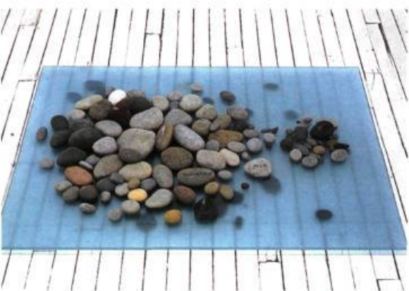
Vers , 2002-2003 (détail) Plaque de verre sablé, pierres et pierres gravées 76 x 106 x 8 cm

Dans cette œuvre, partout où nous en faisons l'expérience, perdue un avant et un après. Vers nous projette au cœur de la chose, du centre où nous sommes à celui d'où nous fûmes, en plein historique du regard. Le point de vue ici n'est pas une astuce pratiquée par l'anamorphose ou les stratégies de la perspective, il est une frontière critique. Une position privilégiée par laquelle, en tant qu'élément voyelle, nous sommes en affixe. Cet avant et cet après du lieu où nous sommes prennent effet par l'expérience sensible des objets et de leur deuil en tant que distance efficiente. En nous y inscrivant nous participons nécessairement