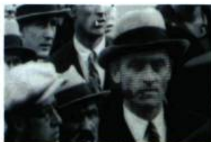
Chris Curreri Untitled (détail), 2002 Tiré de la série The Bicycle Race

La Galerie d'art de l'université Bishop's Rue College Street Lennoxville http://www.ubishops.ca/ artgallery.htm Du 14 janvier au 21 février 2004