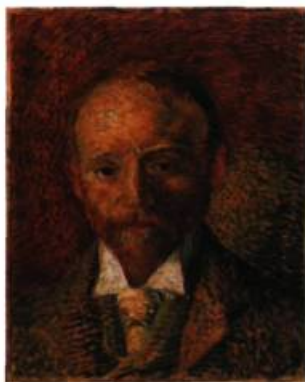
Vincent Van Gogh Portrait d'Alexandre Reid, 1887 Huile sur carton 41 x 33 cm