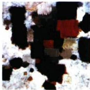
Mars IV, 2002 Huile sur toile 142 x 142 cm

Une réputation flatteuse précède Dominik Sokolowski, peintre de 27 ans qui compte déjà une bonne douzaine d'expositions individuelles à son actif qui lui ont valu une brochette de critiques fort élogieuses. À cet âge, les sources d'inspiration, tout comme les influences, sautent aux yeux de l'amateur d'art un peu averti. Ainsi déchiffre-t-on sur les toiles du jeune artiste des vers de Nelligan et de