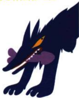
Women's Lib , 1976 Sérigraphie 102 x 67 cm