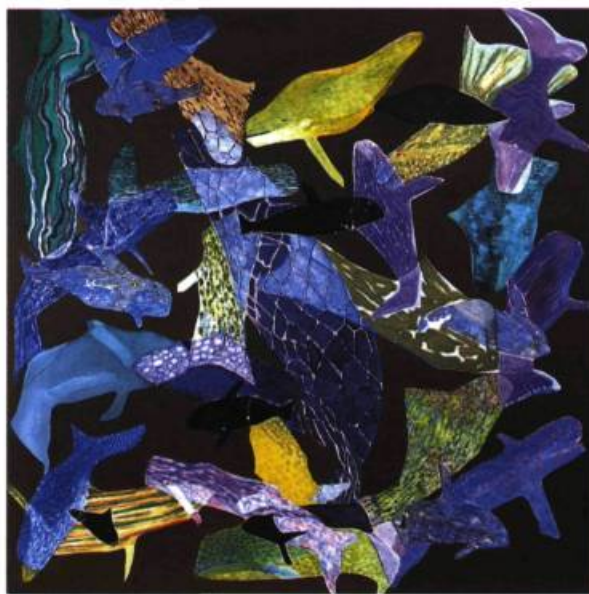
Baleines , 2000 Acrylique sur toile 150 x 145 cm.