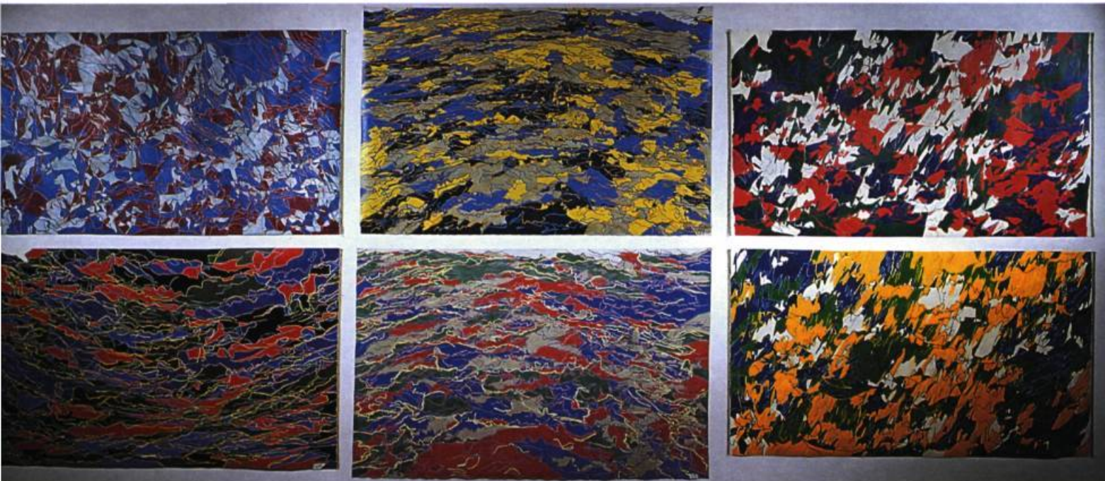
Sillages de bateau , 1986-1987 Série de six huiles sur toile Dimensions variées. Env. 135 x 200 cm, chacune