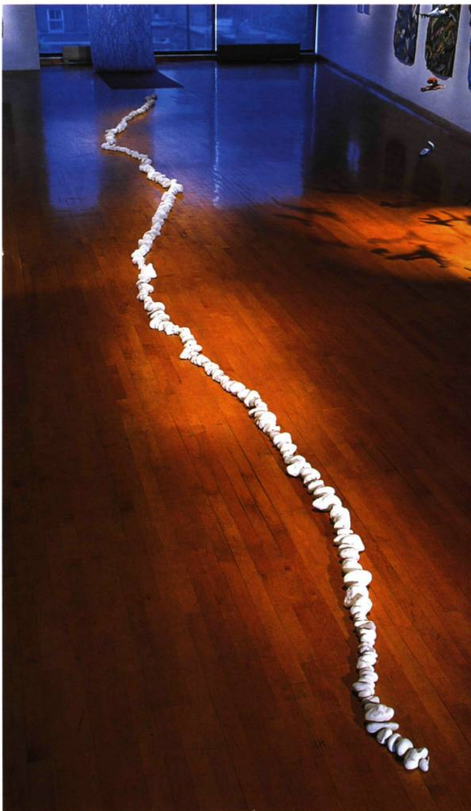
Collier de la mer , 1996 Pierres calcaires, fil métallique 15 m

En face, quatre œuvres sur papier fait main dépeignent une multitude de poissons et de baleines difformes nageant dans des eaux aux couleurs malsaines. L'artiste se préoccupe depuis longtemps d'écologie et des dangers qui guettent la vie marine. Pour elle, les baleines symbolisent parfaitement cette vie à préserver. Séparant cette série d'œuvres sur papier intitulées Baleines d'une seconde série de trois œuvres sur papier intitulées tout simplement Vagues