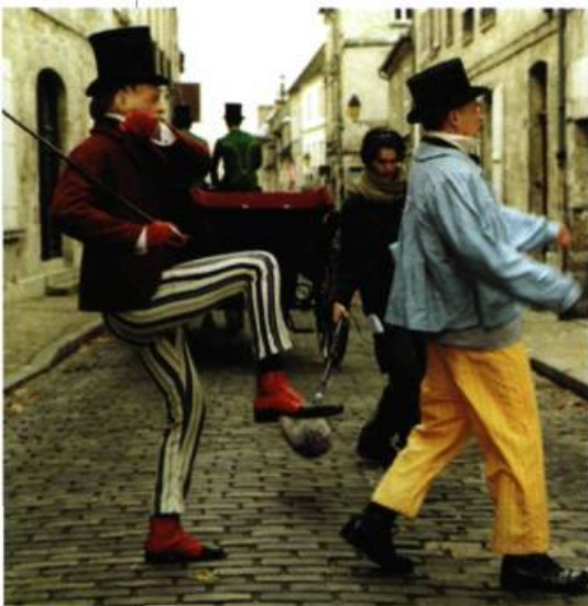
Rodney Graham City Self/Country Self , 2001 Film 35mm transféré sur DVD (loop de 4 minutes) Vancouver Art Gallery Acquisition Fund

DOUTE NOS CERTITUDES QUANT À LA RÉALITÉ DU MONDE ET DE L'IDENTITÉ.