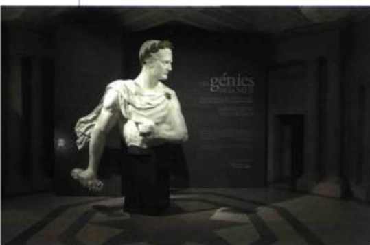
Attribué à l'atelier de sculpture de l'arsenal de Brest, Buste de Napoléon I er , figure de proue du vaisseau Le Iéna , vers 1846(c) Musée du Québec / Jean-Guy Kerouac

LA CARGAISON DE CHEFS-D'ŒUVRE DU MUSÉE NATIONAL DE LA MARINE RETROUVE SON PORT D'ATTACHE : PARIS.