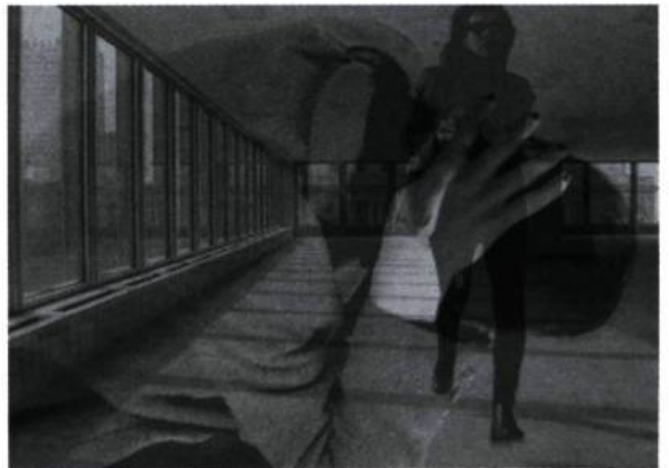
Requiem (détail), 2003 Vidéo

L'œuvre sera présentée au public pour la première fois dans la vitrine du magasin Georges Laoun opticien, par projection sur un écran transparent. Ce dispositif particulier permettra aux clients de l'établissement, ainsi qu'aux passants de contempler simultanément le court métrage.