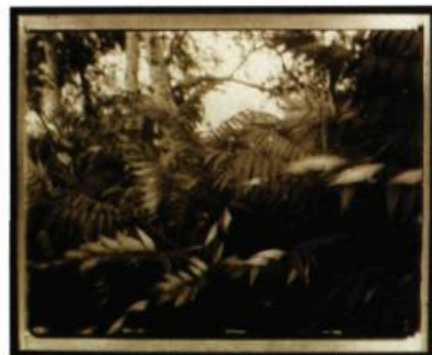
Evergon (a.k.a. / pseud. Egon Brut) L'autoroute 40 (Ottawa/Montréal). Halte routière, vent et érables blancs Détail de la série Forêts enchantées du folklore gay : Relais routiers et sentiers des amoureux , 1995 Épreuve à la gélatine argentique 77 H 93 cm chacune Musée canadien de la photographie contemporaine, Ottawa

Afin de célébrer dix ans de remarquables expositions au cœur d'Ottawa, le Musée canadien de la photographie contemporaine présente Confluence. La photographie