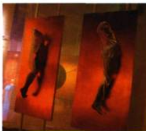
Reiku Kruk Le cri de la peau Installation (Japon et France).

Privilégiant un traitement scientifique mais ne négligeant pas les aspects philosophiques, anthropologiques et artistiques, l'exposition aborde la peau en explorant la relation entre les concepts d'identité et de frontière. En visitant un parcours qui regroupe par thématiques divers objets tels des moulanges de l'Hôpital Saint-Louis à Paris, ainsi que des œuvres d'art notamment de William Pink et de Roberto Pellegrinuzzi, le visiteur apprend à mieux connaître la peau sous toutes ses coutures sociales, culturelles et biologiques.