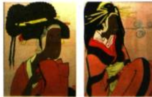
Iona Rozeal Brown, a3blackface#3+#10 , 2000

La rue : lieu de convergence, mode de vie, expression d'une culture alternative qui a inspiré de nombreuses productions artistiques restées en marge de l'histoire de l'art depuis les vingt dernières années. L'exposition Mass Appeal: l'objet d'art et la culture hip hop , une production de la Galerie 101 d'Ottawa, réunit 12 artistes originaires des États-Unis et d'Europe qui ont recours notamment à la sculpture, la photographie, la vidéo, la performance et la peinture afin d'illustrer les particularités de cette sous-culture populaire à laquelle ils adhèrent.