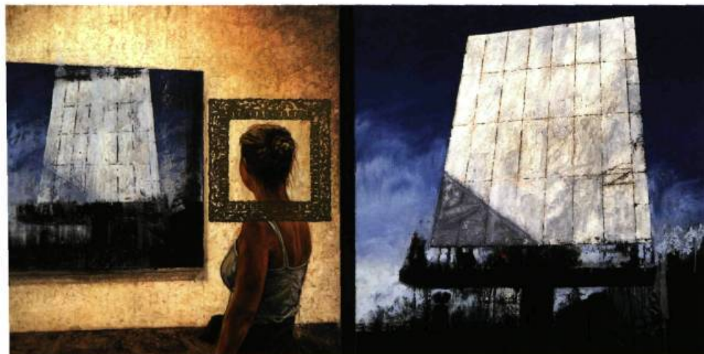
Enjoliver le regard / Projeter du sens, 2002 Huile sur toile 107 x 214 cm Collection privée, États-Unis

ET L'IMAGE MÉDIATIQUE EN FORME D'INTERROGATION SUR LE MONDE CONTEMPORAIN.