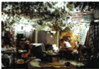
Jeff Wall After Ralph Ellison, The Invisible Man, The Preface , 2001

12 inscriptions qui font référence aux signes de la dépression que l'on rencontre dans des publications de psychologie populaire, où le lecteur peut évaluer son état psychique à l'aide de tests. Se superposant à notre image, on rencontre les phrases « Je suis toujours fatigué », « Je pleure sans raison », « Je me sens seul au monde » ou « La vie ne vaut pas la peine d'être vécue ». Misant sur l'identification du spectateur à ces symptômes, Lum provoque des réactions ambivalentes entre l'identification et l'aliénation. Chacun se trouve confronté à lui-même, non seulement à sa propre image démultipliée, visible sous des angles habituellement non perceptibles, mais aussi à sa propre vulnérabilité, accentuée par la lecture déstabilisante de ces petites phrases incisives qui s'insinuent lentement en lui. De plus, la perception corporelle est troublée par la confusion qui surgit lorsque l'on se heurte à une surface de miroir. Qui suis-je? Qui est l'autre? Quelle est la différence entre moi et l'autre? Que le plus fort parvienne à ne pas baisser les yeux.