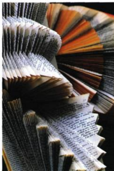
Paule Samson Livres aux pages pliées, 2002

Regroupant 37 tentures, l'exposition sera ensuite présentée à la Winnipeg Art Gallery (du 21 août au 12 octobre 2003), à la Art Gallery of Ontario (du 1 er novembre 2003 au 11 janvier 2004) et finalement au Macdonald Stewart Centre (du 20 mai au 29 juillet 2004).