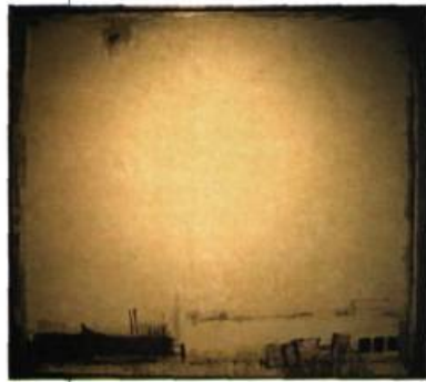
Manuel Bujold Urbanité 2003