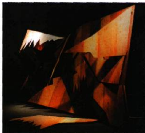
Joëlle Morosoli Déchirure , 1989 Aluminium, masonite, mécanisme, moteur 2,20 X 4, 90 X 2,30 cm

Le Centre d'exposition du Vieux-Palais présente Architecturer le temps , une exposition composée de sept installations de l'artiste Joëlle Morosoli. La matière première de