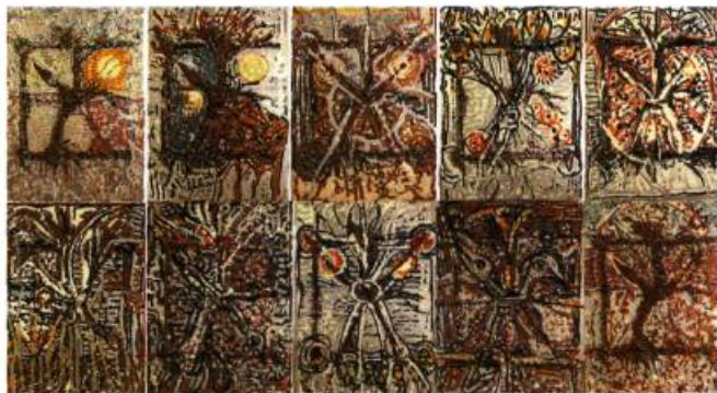
Jean-Paul Riopelle Sans-titre Technique mixte, sérigraphies rehaussées 2 (116, 6 X 75 cm) Art Gallery of Hamilton

Si l'œuvre vaste et complexe de Riopelle s'est prêtée à des études et à des activités de recherche du vivant de l'artiste, elle fera sûrement l'objet de nombreuses autres analyses critiques au cours des années à venir. Ainsi, Monique Brunet-Weinmann – spécialiste de Riopelle – s'est intéressée au travail de «couper-coller», qui consistait à modifier des estampes par collage, assemblage et médiums mixtes, afin d'en faire des pièces uniques. Il en résulte une exposition de treize œuvres, réalisées entre 1967 et 1989 à partir de ce processus, accompagnée d'un catalogue.