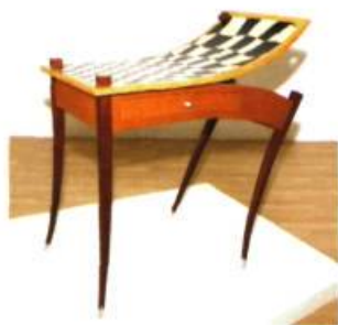
Félix Lapierre Mouvement I Contre-plaqué russe, érable, bloodwood, lacewood, movluguï, aluminium 84 X 84 X 51 cm

Félix Lapierre, ébéniste-sculpteur, a remporté le prix François-Houdé 2002 visant « à reconnaître et à promouvoir l'excellence de la nouvelle création montréalaise en métiers