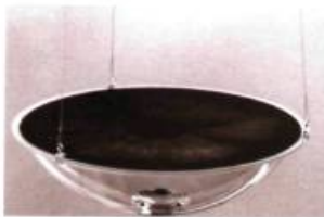
Annie Thibault Fairy Ring , 2001 Intégration des arts à l'architecture

Le grand hall du Musée du Québec est envahi de cultures fongiques! Inutile d'emmener votre détergent lors d'une prochaine visite puisque ces moisissures ont été amoureusement cultivées par l'artiste Annie Thibault. En effet, l'espace réservé depuis quelques années aux jeunes artistes, est occupé par l'œuvre Fairy Ring , une installation intégrée temporairement à l'architecture du hall.