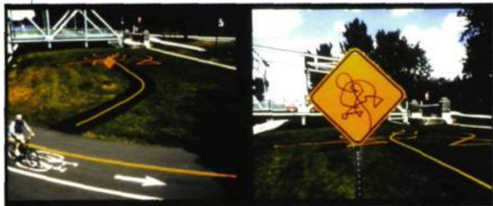
Michel de Broin Entrelacement , 2001 12 tonnes de bitume, peinture signalétique Artefact 2001 40 mètres carrés

Pour l'année 2002, le prix Louis-Comtois pour les artistes à mi-carrière est décerné à Alain Paiement et le prix Pierre-Ayot pour la relève en arts visuels revient à Michel de Broin. Ces prix sont remis annuellement par la Ville de Montréal, qui s'engage à faire l'acquisition d'œuvres des lauréats, en collaboration avec l'Association des galeries d'art contemporain (AGAC).