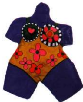
Niki de Saint Phalle Baigneuse (Last Night I Had a Dream) , 1968 Polyester peint 120 x 94 x 17 cm Collection Galerie Bonnier, Genève, CH

Sa rencontre avec Jean Tinguely, dont les machines délirantes commençaient à faire parler d'elles,