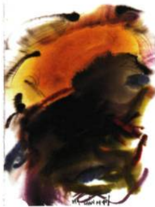
Chan Ky-Yut Sans titre, 2002 Encre et aquarelle

D'importantes expositions des œuvres de Chan Ky-Yut ont lieu en France et en Angleterre au cours de l'hiver 2002-2003. L'artiste et critique d'art français Jérôme Coignard (on peut voir ses œuvres à la Galerie Jean-Claude Bergeron, 150, rue Patrick, à Ottawa) a vu, notamment au Victoria & Albert Museum à Londres, le travail de Chan Ky-Yut: peintures, ouvrages de bibliophilie réalisés avec des poètes et des auteurs clés du monde littéraire international, bannières de papier, manuscrits. Il a récemment écrit: « On perçoit le souffle du peintre dans l'accomplissement de son travail. [...] Son travail n'emprunte pas l'arabesque familière de l'art occidental, de Léonard de Vinci à Matisse, d'Ingres à Pollock. Chan Ky-Yut ne cherche jamais le « beau geste », la courbe harmonieuse, la composition babilé. » La variété de la production de Chan Ky-Yut pourra être contemplée de part et d'autre de la Manche dans les lieux suivants: