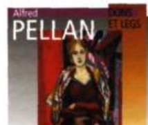
Lancement du calendrier Dons et legs 2003